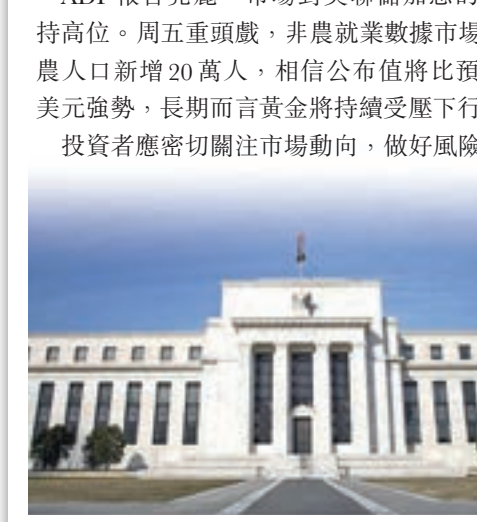
(以上內容屬個人觀點,僅供參考)

周三(3月7日),白宮首席經濟顧問科恩突然宣佈辭職金價上升一度觸1,340美元。其後大幅回落,可見是因為美國ADP公布2月份就業資料,就業人數增長了23.5萬人,而1月份修正後為增長24.4萬人。再者,朝鮮局勢似乎有所緩和,美聯儲官員講話及周四凌晨公佈的美聯儲經濟褐皮書等多項因素,支持美元短線上揚,金價受壓。 ADP報告亮麗,市場對美聯儲加息的預期維持高位。周五重頭戲,非農就業數據市場預測非農人口新增20萬人,相信公布值將比預測好。美元強勢,長期而言黃金將持續受壓下行。 投資者應密切關注市場動向,做好風險管理。