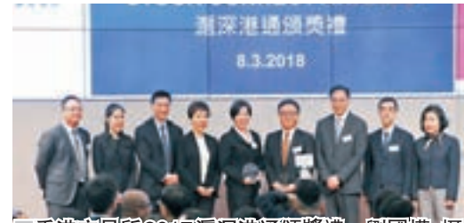
香港交易所2017滬深港通頒獎禮。

香港文匯報訊(記者 岑健樂)港交所(0388)昨於新開幕的香港金融大會堂,舉辦2017年度滬深港通頒獎禮,以表揚主要經紀商於過去一年,參與滬深港通所取得的成績。滬深港通與深港通分別於2014年底與2016年底推出,讓內地與香港投資者透過各自市場的交易所,買賣兩地市場上約共2,000隻合資格證券。去年,兩者分別進入第3周年與1周年,南北向交易成交量大增。其中,北向成交金額激增3倍至22,660億元人民幣;而南向成交量,則上升170%至22,590億港元。