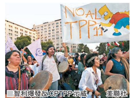
智利爆發反CPTPP示威。