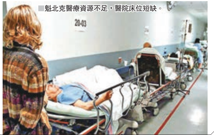
魁北克醫療資源不足，醫院床位短缺。

美國總統特朗普上周宣佈計劃對進口鋼材和鋁產品加徵關稅，加上立場較溫和的白宮首席經濟顧問科恩宣佈辭職，各國憂慮貿易戰如箭在弦。白宮官員透露，特朗普會於當地時間昨午(香港時間今日凌晨)簽署文件，確定最快在兩星期後徵收鋼鋁關稅，但據報華府計劃加設條款，豁免加拿大、墨西哥以至歐盟等地區，減輕盟國疑慮，與特朗普此前聲稱沒有國家可獲豁免的說法明顯有別。