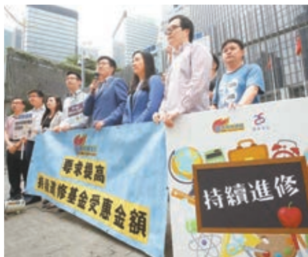
社會各界多希望政府提高持續進修基金的受惠金額。

關注到如何改革持續進修基金以滿足打工仔的需要，工聯會職訓就業委員會於2017年9月舉行了一次「在職人士持續進修」問卷調查發佈會，並於同年11月7日致函立法會人力事務委員會，要求政府正視持續進修基金乏人問津的原因。從工聯會職訓就業委員會的問卷調查發現，95%受訪僱員認為持續進修重要。但調查同時發現，在過去兩年51%受訪僱員任職的公司沒有提供例如學費津貼、上班時間外出進修及有新培訓假期等持續進修措施。55%沒有提供任何在職培訓。其次，雖然普遍香港僱員認為持續進修重要，但47%受訪僱員過去兩年沒有報讀任何進修課程。對於為何那麼多僱員沒有持續進修，無時間(61%)為受訪僱員持續進修的主要障礙，其次為學費昂貴(40%)。