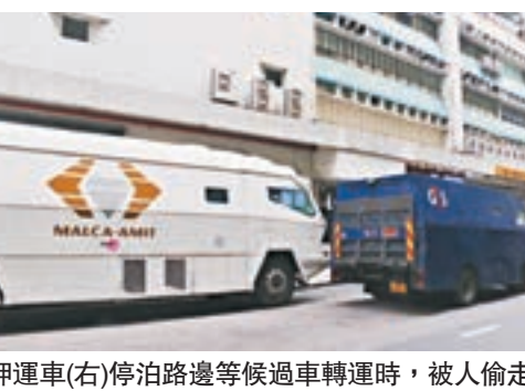
押運車(右)停泊路邊等候過車轉運時,被人偷走600多萬元珠寶。

後,受紅磡區一間珠寶公司委託將十多篋物品,包括珠寶等運到葵涌3號貨櫃碼頭一貨倉暫存一晚,及至前日早上才再將物品運送予物主。惟在押運途中,押運車曾停泊紅磡民樂街路邊,即報案的押運公司辦事處斜對面,並卸下多篋物品放在行人路過車轉運,不料其中一個載有約值620萬元珠寶的行李篋,被一名戴帽及口罩,身高約5呎7吋高,穿黑衫,貌似南亞裔的男子偷走。 警方立即派員到場調查,由於案中涉及的珠寶價值不菲,案件其後轉交九龍城警區重案組跟進。據悉,警方目前正全方位調查事件,除向當時負責押送珠寶的押運員和司機錄取口供外,又