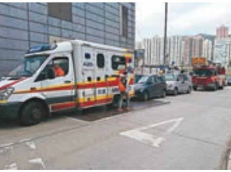
救護車和消防車在起火地盤外戒備。

「海之戀」地盤位於荃灣大河道西鐵站上蓋。昨晨9時許,上址第三座高層約30樓突有單位的露台雜物冒煙起火,其後又見多處地方雜物冒煙有火光,工人立即報警。消防員到場開動兩條喉及出動兩隊煙帽隊進行灌救,至早上11時許將火救熄,其間一共發現多達8處火頭,認為有可疑,另有約50名工人自行疏散到地面安全位置,幸無人受傷。 詎料至中午時分,消防又再接報上址地盤第二座低層有兩處雜物起火,到場約1小時後將火救熄,無人受傷。 由於上址地盤在3小時接連發生兩宗火警,共涉及10處火頭,另在去年11月至12月間,同一地盤亦先後發生3次火警,因而認為火警有可疑。