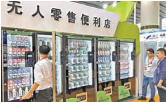
24小時無人便利店在珠三角城市群日趨火熱。

除了新式的無人便利店，智能鮮椰飯賣機、現炸薯條販賣機、自助爆米花機、冰激凌售賣機、紅薯烘焙販賣機、智能煮麵售賣機等售賣「鮮」貨自助機也紛紛亮相。香港文匯報記者看到，智能煮麵機吸引不少採購商駐足，39秒就能現場做出一碗熱乎乎的米粉或者牛肉麵。 展會現場還展示了業內最新科技，如利用3D掃描儀對便利店、導購員及其商品進行掃描，接着通過建模形成完整的線上便利店，用戶只要點擊進入線上便利店，便可如同走進店內場景進行購物，先進的眼球追蹤技術和專業3D導購員還可以為用戶展示商品及答疑解惑。