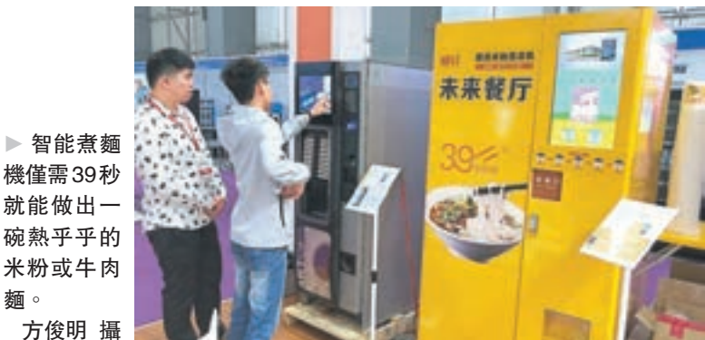
智能煮麵機僅需39秒就能做出一碗熱乎乎的米粉或牛肉麵。