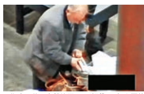
■ 斯里普爾喜歡使用LV手提袋。

300名俄國特工身份。據報斯里普爾險被處決，後來被「輕判」監禁13年。2010年7月，美俄在奧地利維也納交換間諜，規模是冷戰後最大，引起轟動，斯里普爾是獲俄羅斯釋放的其中一人，潛伏美國的「美女間諜」查普曼則返俄。查普曼此後為俄羅斯政府擔任宣傳人員，更在社交網站開設賬戶，2015年誕下兒子，前年公開支持特朗普