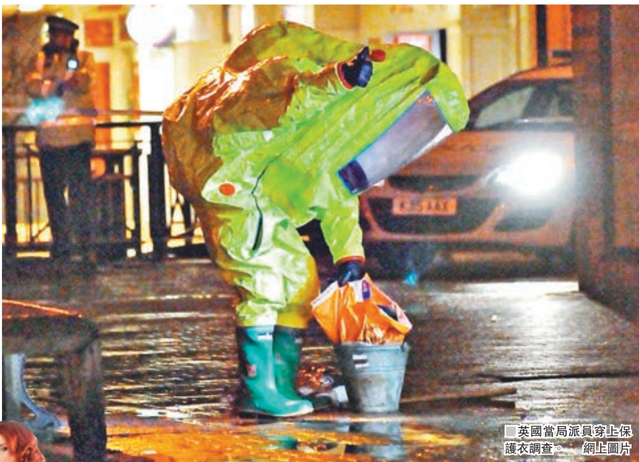
■ 英國當局派員穿上保護衣調查。網上圖片

43歲的利特維年科於2006年前往英國後，在倫敦喝下摻入放射性鈾元素的綠茶後中毒身亡，英國事後調查發現，事件可能與俄總統普京有關。利特維年科的遺孀馬林娜稱，斯里普爾事件與丈夫當年遭下毒相似，但現階段仍需要更多資料查證。 ■路透社/美聯社/法新社