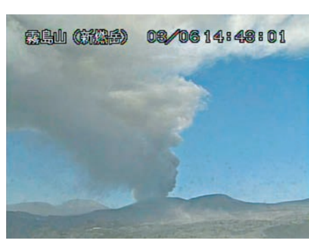
鹿兒島(特報) 03/06 14:48:01

火山灰影響鹿兒島機場交通，昨日香港航空一班由鹿兒島前往香港的航班取消，另有部分航班轉到鄰近的福岡或宮崎機場降落。國土交通省鹿兒島機場辦公室昨加緊清理火山灰，盡力確保今日機場服務正常。