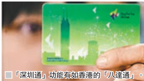
■「深圳通」功能有如香港的「八達通」。

上萬深圳市民便捷乘車和地鐵的便捷電子支付工具，市民可以在地鐵站和許多便利店如萬店通、百里臣、7-11等便利店和中行自助終端機充值。市民使用「深圳通」乘坐公交可以享受六五折至八折優惠，享受地鐵的九五折票價優惠。