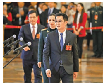
■馬化騰指香港跨行轉賬時間太慢。

其中騰訊(0700)主席馬化騰日前在北京表示，將在香港大力發展移動支付業務，期待本港監管當局在政策上可作出配合。他又