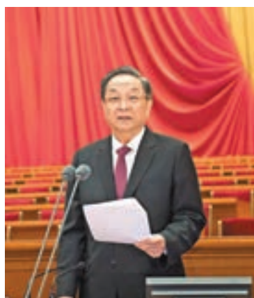
十二屆全國政協主席俞正聲向大會報告過去五年的工作。

全國人大會議將審議通過深化國家機構改革方案，並選出國家政府領導人。人們將拭目以待。