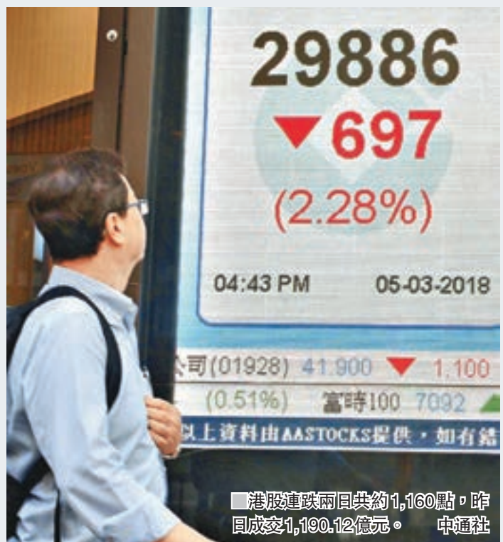
■ 港股連跌兩日共約1,160點，昨日成交1,190.12億元。中匯社