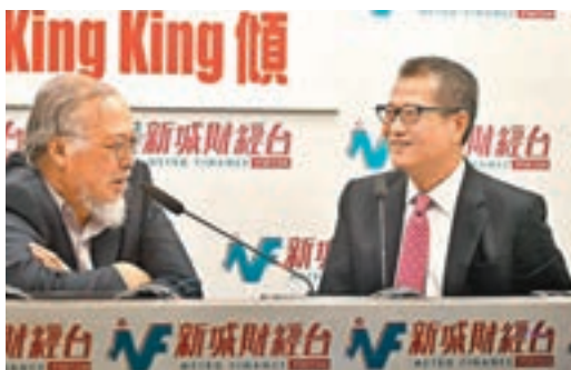
■ 陳茂波強調，部分游資流走將令香港利率趨正常化速度更為理想。

香港文匯報訊(記者 馬翠媚)港元持續疲弱，市場憂慮本港將有資金流出風險，港股昨日急跌近700點。財政司司長陳茂波昨出席電台節目時則大派定心丸指，08年金融海嘯後有約1,300億至1,400億美元流入本港，市場預期美聯儲年內有機會加息3至4次以及推行稅改和縮表等，料將吸引部分資金回流美國，但他強調部分游資流走將令香港利率趨正常化速度更為理想，又指金管局將密切注視有關情況，以確保金融市場有序運作。