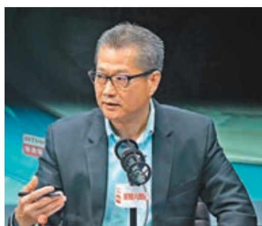
陳茂波承認預算案覆蓋面不夠周全。

陳茂波表示，即使面對不同政黨施壓或團體示威遊行施壓，也不會「轉軌」改為全民派錢。政府已經委託關愛基金「補漏拾遺」，政府已初步構思大致範圍，但仍然要聽聽社會意見，而有關的行政措施不會太複雜，否則會擾民。