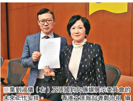
葉劉淑儀(右)及張國鈞向傳媒展示委員會的未來工作安排的合照。

另外，委員會將於月內舉行7小時的公聽會，每名代表可發言3分鐘，預料可讓100名代表在會上表達意見，並可因應情況需要加時。