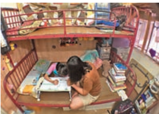
「拾遺」同時正考慮以舊電器換高能源效益電器的方式來協助割房戶。資料圖片