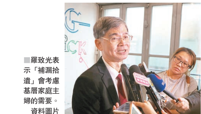
羅致光表示「補漏拾遺」會考慮基層家庭主婦的需要。

邱騰華又說，高鐵和港珠澳大橋等大型基建相繼落成，對旅遊業前景感到積極，政府會利用對旅遊業的注資，研究如何融合本港特色和景點，做到多元旅遊，例如發展深水埗時裝中心，推廣本地時裝吸引旅客。政府亦會發展科技旅遊，例如研發手機應用程式，顯示景點位置、配套和交通，幫助旅客自行規劃行程。