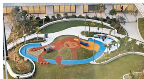
▲兒童醫院兩座大樓之間設綠化地帶的中央復康花園。