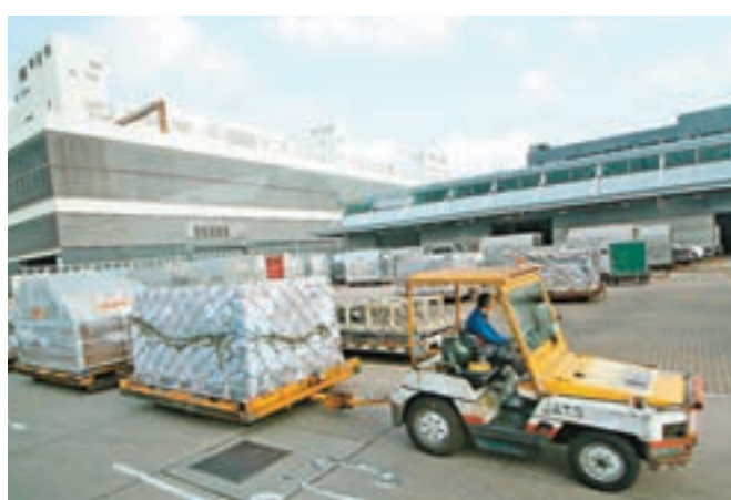
▲香港機場已連續7年成為全球空運貨量最多機場，更是全世界首個處理超過500萬公噸貨運及航空郵件機場。