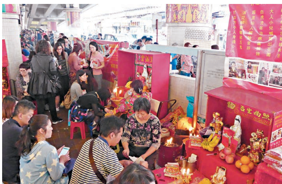
▲昨日是中國傳統廿四節氣的「驚蟄」，有市民特地往灣仔鵝頸橋「打小人」。