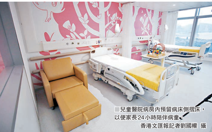
▲兒童醫院病房內預留病床側摺床，以便家長24小時陪伴病童。