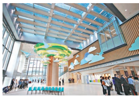
▲兒童醫院大堂設計採用兒童及家庭友善概念。

身兼觀塘區議員、工聯會立法會議員何啟明則擔心，區內交通未能應付新醫院投入服務，尤其是九龍灣面對塞車問題，促請政府研究水陸交通的可行性。