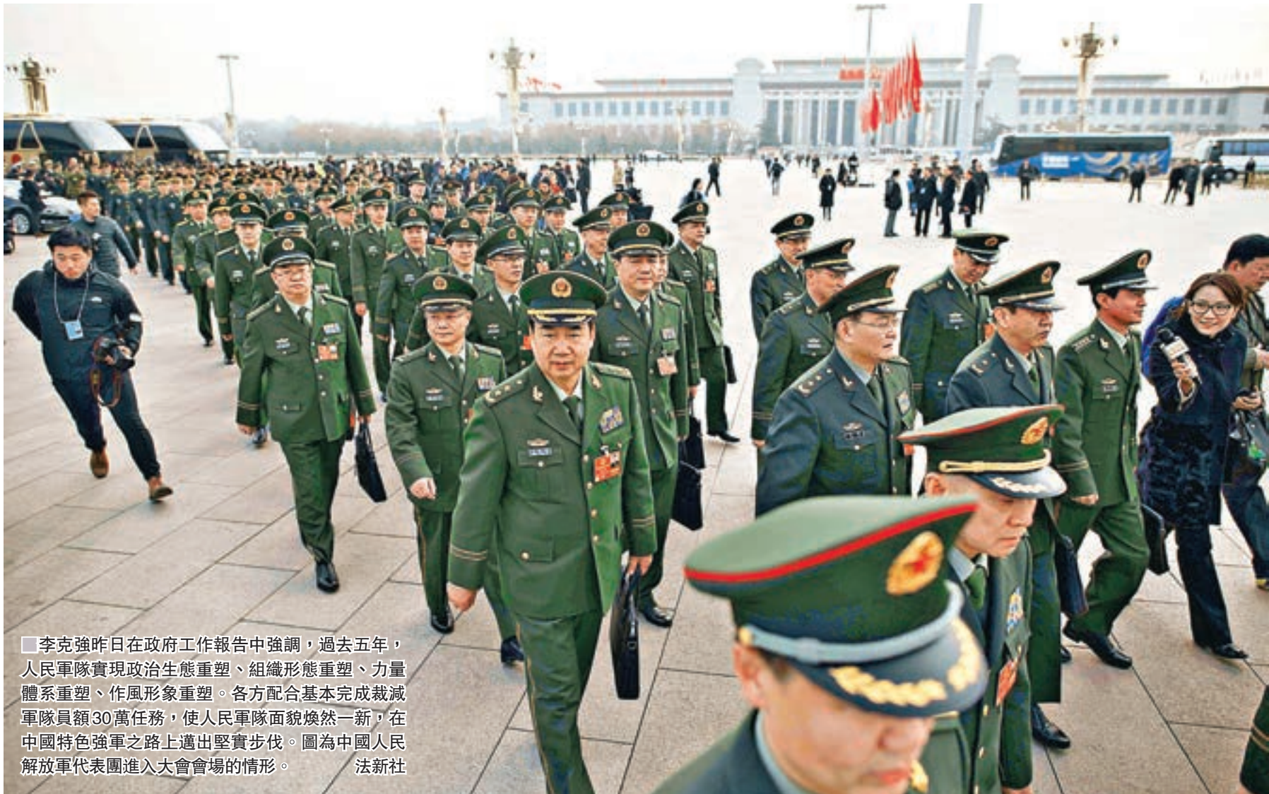
李克強昨日在政府工作報告中強調，過去五年，人民軍隊實現政治生態重塑、組織形態重塑、力量體系重塑、作風形象重塑。各方配合基本完成裁減軍隊員額30萬任務，使人民軍隊面貌煥然一新，在中國特色強軍之路上邁出堅實步伐。圖為中國人民解放軍代表團進入大會會場的情形。

香港文匯報訊（記者 葛沖 北京報道）國務院總理李克強昨日在政府工作報告中強調，過去五年，人民軍隊實現政治生態重塑、組織形態重塑、力量體系重塑、作風形象重塑。有效遂行海上維權、反恐維穩、搶險救災、國際維和、亞丁灣護航、人道主義救援等重大任務。各方配合基本完成裁減軍隊員額30萬任務。軍事裝備現代化水平顯著提升，軍民融合深度發展。人民軍隊面貌煥然一新，在中國特色強軍之路上邁出堅實步伐。