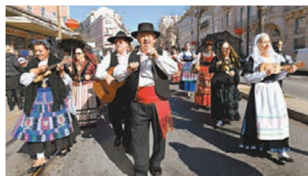
在葡萄牙首都里斯本市，葡萄牙米尼奧歌舞團的演員在「歡樂春節」中表演。