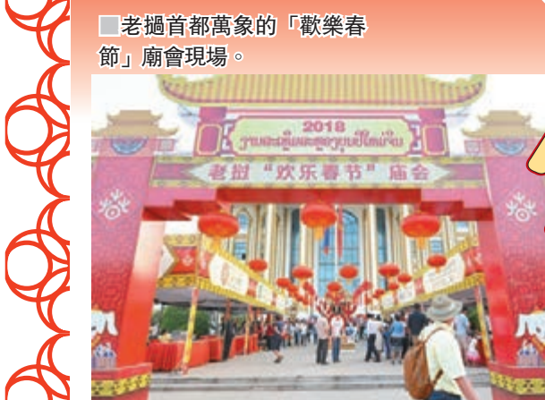
老撾首都萬象的「歡樂春節」廟會現場。