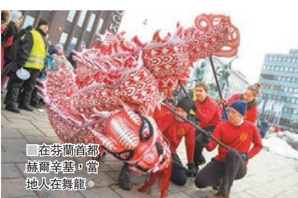
在芬蘭首都赫爾辛基，當地人在舞龍。

世界各國不少地方都在「歡樂春節」活動中表演舞龍舞獅，寓意新年興旺，齊齊喜迎中國農曆新年。例如，由中國駐葡萄牙大使館和里斯本市政府聯合主辦的「歡樂春節」活動在葡萄牙首都里斯本舉行，而在意大利羅馬，則有演員在街頭舞龍，吸引意大利市民及遊客觀看。