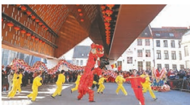
在比利時東法蘭德斯省首府根特市中心，當地舞龍舞獅隊在春節巡遊活動上表演。

在比利時東法蘭德斯省首府根特市中心，當地舞龍舞獅隊在春節巡遊活動上表演。這是繼2016和2017年布魯塞爾舉辦「歡樂春節」盛裝大巡遊活動之後，首次由比利時華僑華人社團和比利時根特市共同舉辦的春節大巡遊。