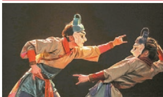
「歡樂春節」中東歐五國巡演在波黑拉開序幕。