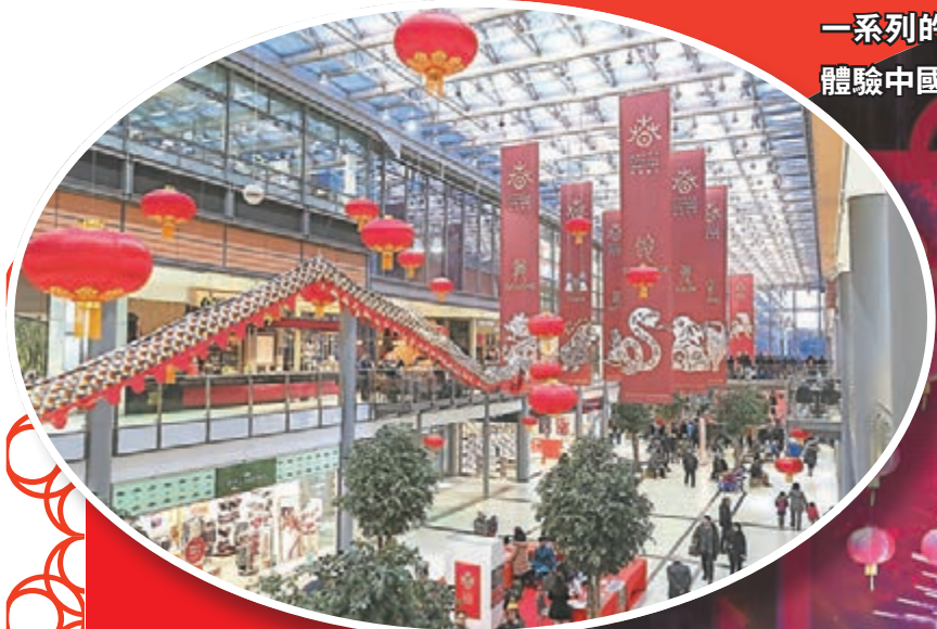
德國柏林波茨坦廣場一購物中心充滿中國特色的裝飾。