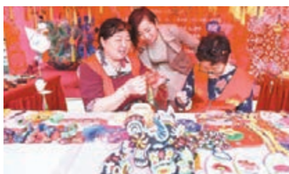
「2018香港歡樂春節文化廟會——中華源·老家河南」在港舉辦。

在我們香港，九龍公園舉行了「2018香港歡樂春節文化廟會——中華源·老家河南」，主辦方聯合河南省，精心組織了少林功夫、汝窯瓷器、特色小吃、非遗民俗、名優物產等板塊，通過展覽、表演、互動體驗的方式，向香港展示原汁原味、燦爛多姿的中原文化。另外，由老撾中國文化中心主辦的2018年「歡樂春節」廟會活動則在萬象舉行。