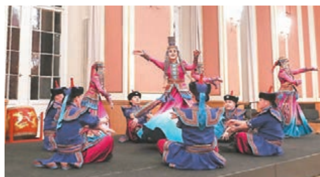
在德國柏林市政廳，演員在「歡樂春節」文藝晚會上表演舞蹈。

中國浙江婺劇藝術團在中國駐瑞士大使館舉辦的新春招待會上獻上精彩演出，讓在場的中瑞各界人士領略中國傳統文化的魅力。