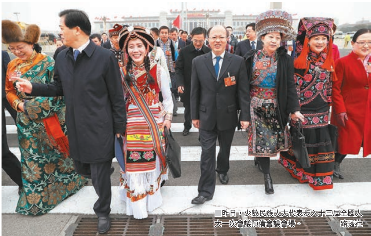
昨日，少數民族代表步次十三屆全國人大一次會議預備會議會場。

同時，改革和理順市場監管體制，整合監管職能，加強監管協同，形成市場監管合力。深化行政執法體制改革，解決多頭多層重複執法問題。強化事中事後監管。改變重審批輕監管的行政管理方式，把更多行政資源從事前審批轉到加強事中事後監管上來。創新監管方式，全面推進「雙隨機、一公開」和「互聯網+監管」，加快推進政府監管信息共享，切實提高透明度，加強對涉及人民生命財產安全領域的監管，主動服務新技術新產業新業態新模式發展，提高監管執法效能。加強信用體系建設，健全信用監管，加大信息公開力度，加快市場主體信用信息平台建設，發揮同行業和社會監督作用。