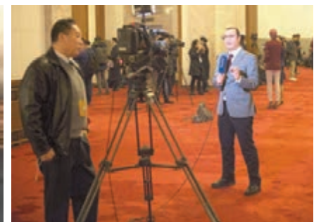
一位外媒電視記者正在十三屆全國人大一次會議發佈會現場進行報道。

英國廣播公司(BBC)報道稱，2018年是中國改革開放40周年，經濟問題將成為此屆兩會的關注焦點。新加坡《聯合早報》報道稱，中