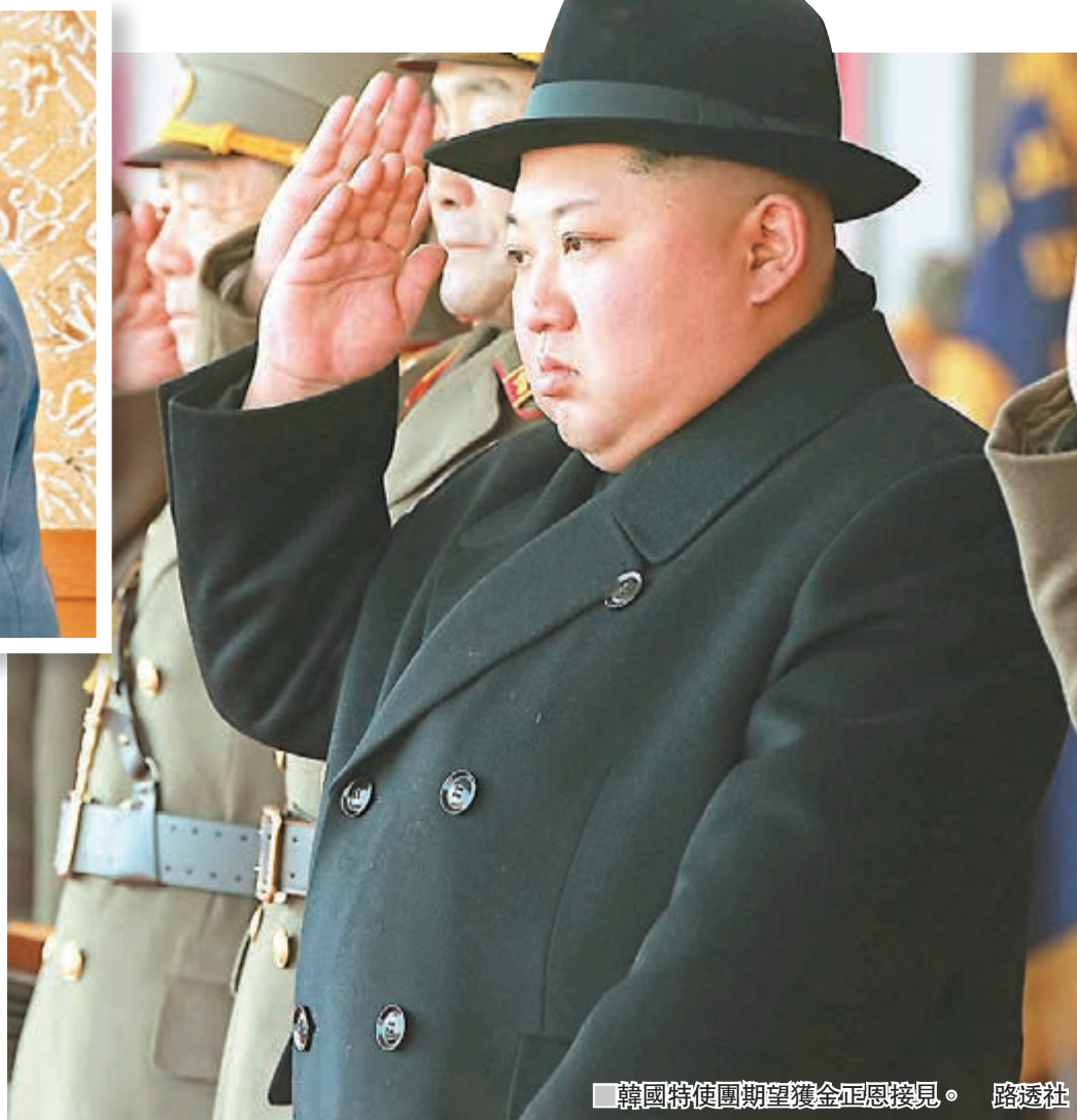
韓國特使團期望獲金正恩接見。