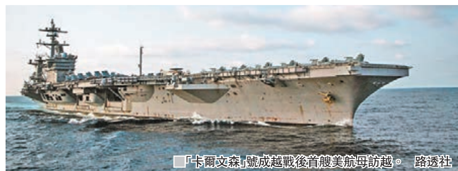
「卡爾文森」號成越戰後首艘美航母訪越。