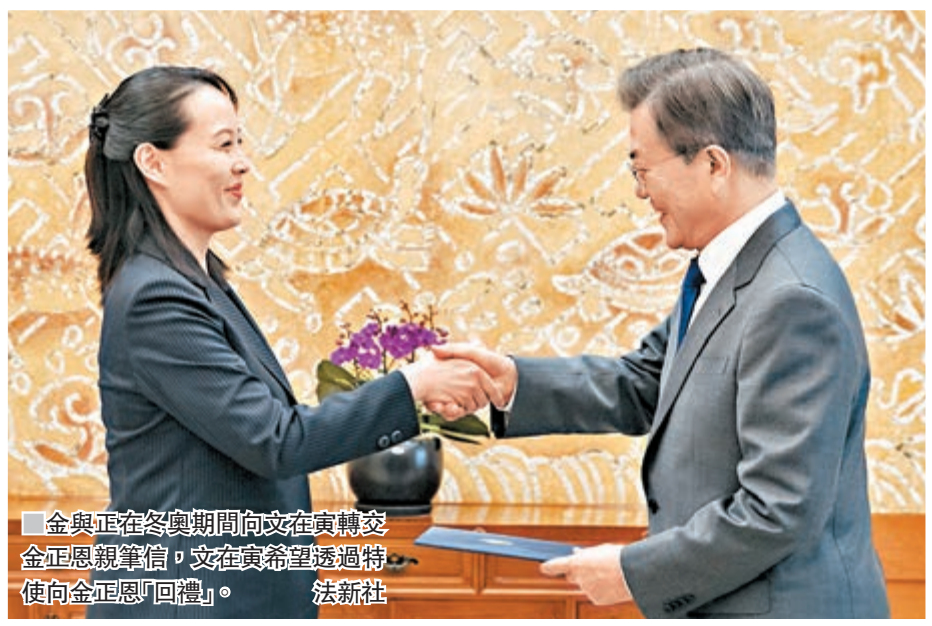
金與正在冬奧期間向文在寅轉交金正恩親筆信，文在寅希望透過特使向金正恩「回禮」。