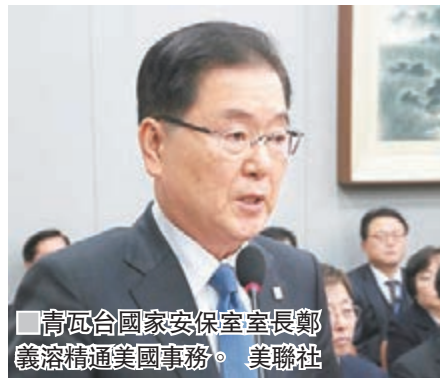
青瓦台國家安室室長鄭義溶精通美國事務。