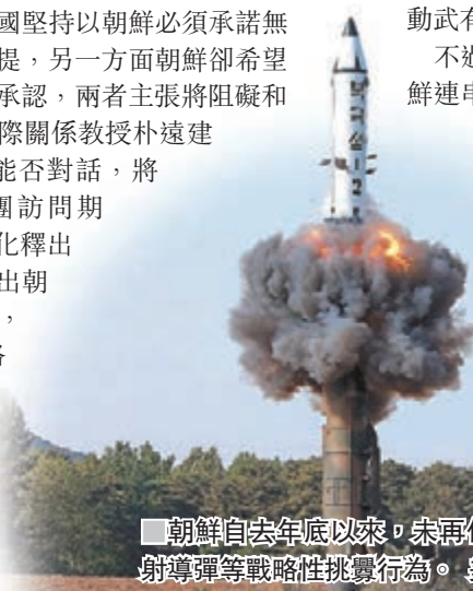
朝鮮自去年以來，未再作出試射導彈等戰略性挑釁行為。

不過美國政界和韓國保守派仍然質疑朝鮮連串外交舉措的意圖，分析認為，韓國應該促使朝鮮作出華府能接受的讓步，其中一個較實際選項是暫停核試和導彈試射，不過這能否符合美國無核化的要求，仍是未知之數。韓國亦應探討方法，讓美朝理解透過雙邊合作達成共同利益。