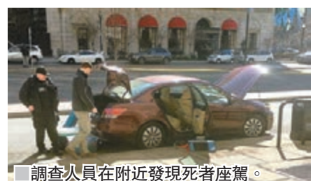
調查人員在附近發現死者座駕。

美國一名白人男子前日走近白宮北面的圍欄外，掏出手槍連開多槍，之後自轟身亡，事件中無其他人受傷，警方事後封鎖現場，在密勒局支援下進行調