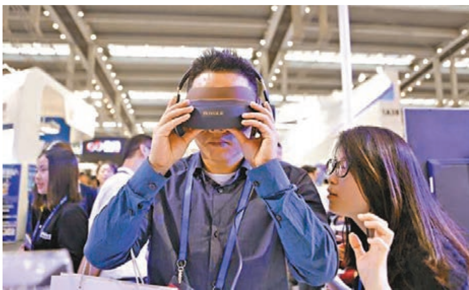
截至2017年底，廣州市通過知識產權貫標認證的企業數量達1,188家，排名全國城市第一。圖為2017廣東知識產權博覽會現場。

統計數據顯示，通過貫標的1,188家企業中，廣州市黃埔區(開發區)、天河區、番禺區的貫標企業數量排名全市前三強，這基本與廣州市各區企業的專利創造相匹配，也與各區的GDP發展大體一致；