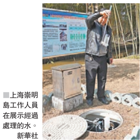
上海崇明島工作人員在展示經過處理的水。

該淨化槽施工工期短，可當天開挖，當天回填。佈點靠近農宅，佔地面積小，戶均管線鋪設短，全地理，實現污水全收集全處理。淨化槽單體每天最小污水處理量1噸，能滿足兩三戶農戶日常使用。