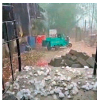
內地南方迎來今年首輪大範圍強對流天氣。圖為廣西桂林雨夾冰雹。視頻截圖

香港文匯報訊 綜合騰訊網、澎湃新聞及中新社報導，在昨日的冷暖空氣碰撞下，內地南方迎來今年首輪大範圍強對流天氣。廣西、廣東、湖南等多地起冰雹，其中有些大如雞蛋。一些汽車擋風玻璃被砸爛，車頂出現凹坑。