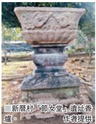
新厝村「節女堂」遺址香爐。

早在1954年，我國就將「男女平等」寫進了憲法，60多年過去了，為什麼還有人熱衷於舉辦歧視女性的「女德班」？「女德班」的性質，與女子師範、女子學校等截然不同，它灌輸的是「守婦道」之類的「德」。單從這一點，就不難看出帶有明顯的男尊女卑成分。現在，遼寧的「女德班」被「叫停」了，其他地方的「女德班」是否還冠冕堂皇地照辦不誤？不錯，傳統文化應當弘揚。然而，時代不同了，社會進步了，對儒家理學等「歷史遺產」，既不能盲目拿來，更不能全盤照搬，而要「取其精華，去其糟粕」，在批判的基礎上繼承和吸收。可是，近年來偏偏有人打着弘揚傳統文化的旗號，幹着為封建思想招魂的事情。聽任其回潮蔓延下去，後果比興辦「女德班」嚴重得多。