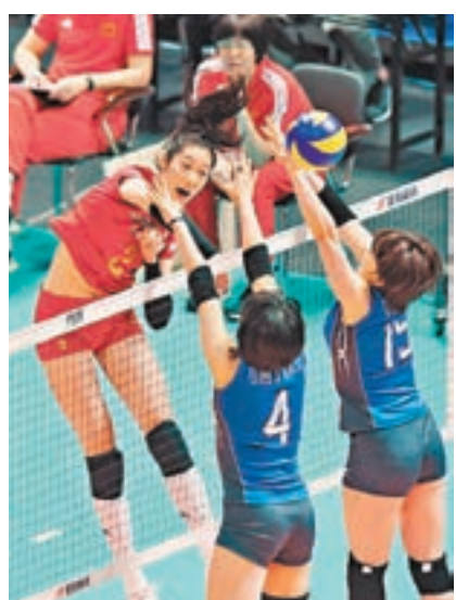
■中國女排(左)將在港與強敵交手。