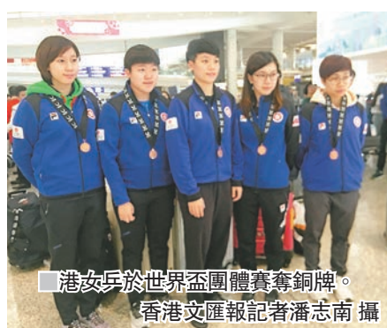
■港女乒於世界盃團體賽奪銅牌。香港文匯報記者潘志南攝

香港文匯報訊(記者 潘志南)香港女子乒乓球隊早前奪得世界盃團體賽銅牌,球隊昨午從英國倫敦凱旋回港。港女隊以全本土培養的球手出戰,總教練陳江華十分滿意她們在整個比賽中表現出很好的抗壓能力。同時,對於從今次奪銅,展望今年亞運獎牌機會?陳江華坦言:「今個賽事爲東京奧運採用賽制,跟亞運會不同賽制,印尼雅加達亞運就只設有五個獎牌,分別是男、女子團體、男、女子單打和混合雙打。實力上我們兩個團體項目可衝獎牌,至於混雙就看運氣。」