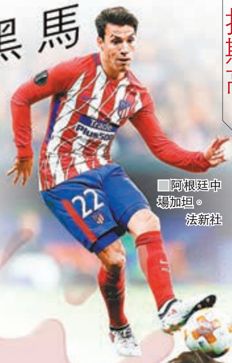
■阿根廷中場加坦。法新社