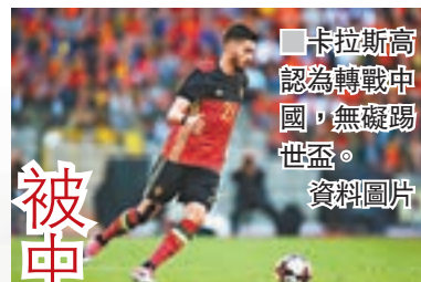
卡拉斯高：被中國足球發展吸引