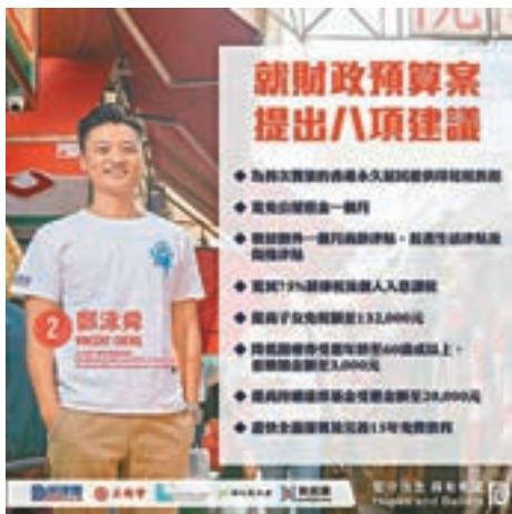
持續進修基金受惠金額至20,000元，更促請全面落实及完善15年免費教育。

鄭泳舜的其他建議更涵蓋老、中、青。他提出降低醫療券受惠年齡至60歲，並增加金額至3,000元，並就在職人士、家庭方面着墨，包括為首次置業的港人提供印花稅折扣、提高子女免稅額至132,000元、提高