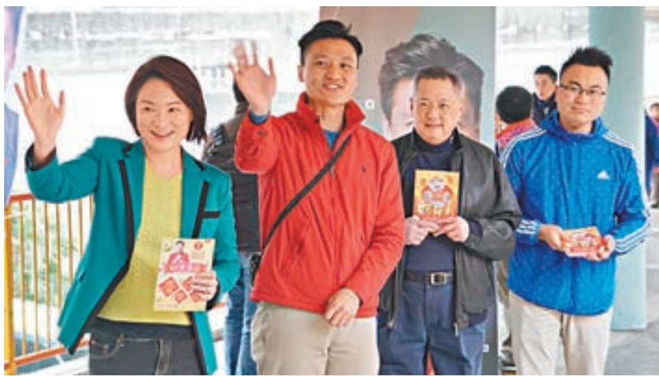
李慧琼、張宇人及林德成昨到黃埔，為鄭泳舜拉票。