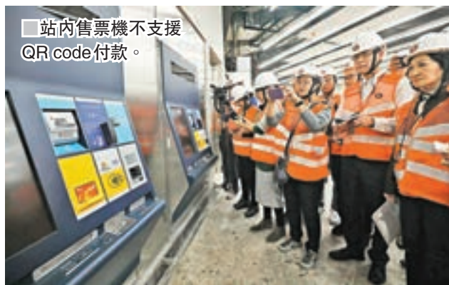
站內售票機不支援QR code付款。