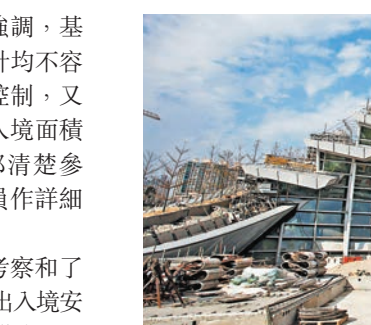
西九龍站正進行檢測，項目將進入試營運階段。

陳帆並透露，運房局已製作一套有關西九龍站乘客路線模擬片段的短片，稍後會在運房局和政府網頁上載，讓市民明白「一地兩檢」基本上與現時香港邊境任何一個關口的過程一樣，都是非常方便和快捷。