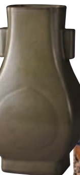
■ 乾隆 茶葉末釉杏圓貫耳尊

東京中央的「竹木文心清玩集雅」專場拍品28件，件件精工絕倫，其中之「清初宗玉款竹雕三星觀畫圖紋筆筒」就是一幅立體文人畫。竹製筆筒以薄地陽文深淺浮雕等技法，通景雕飾庭院人物，中央所雕的梧桐樹下，亭台內一仕女倚案側坐，注視身旁孩童嬉戲，孩童天真爛漫，姿態各不相同，一派生機。筆筒另外一面同樣十分精彩熱鬧，中心所雕福、祿、壽三星觀畫圖，三星神態各異，動靜結合，畫面十分生動。筆筒構圖以寫實手法，展開情節，刀法高度凝練，比例異常精準。筆筒有「宗玉」落款，宗玉清嘉道人，精於刻竹，其作品汲取嘉定朱氏之神髓，而又不拘前人，巧立新風，以巧窮毫髮，極盡微絲為經營之法，開啟了竹刻藝術的精巧之路，可謂獨具一格的開風氣之人物，其精