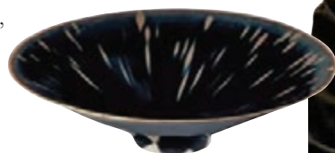
■ 北宋定窯黑釉鸚鵡斑碗

今年紐約亞洲藝術周陶瓷方面異彩紛呈，兩巨頭各有兩個瓷器專場，佳士得方面臨宇山人宋瓷專場、澄園山房專場將閃亮登場；蘇富比也將推一明一清兩大專場，高古瓷方面的最大亮點，非紐約佳士得3月22日臨宇山人宋瓷專場莫屬，該場總計42件拍品，焦點是一件北宋定窯黑釉鸚鵡斑碗，在內地古玩界有「天外飛仙」之譽。這件定窯名品出自波士頓白納德德僑舊藏，後又經日本萬野美術館遞藏至臨宇山人。定窯黑釉器存世寥若晨星，縱觀哈佛大學藝術博物館、大維德基金會及台北故宮所藏諸例，論品質無出本品之右者，本件作為私人收藏中的孤例，堪稱神品。另有一件曾被登記為日本重要美術品的磁州窯綠釉黑剔花牡丹紋尊也將上拍，還有多件器物，如北宋/金磁州窯白地黑花魚藻紋小口尊等都有極佳的傳承，並廣為著錄，以往只能在絕版圖錄中一見，現即將開啟新的遞藏歷程，物色新的主人。