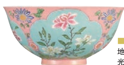
■ 康熙 粉紅地珐琅彩開光花卉碗

此碗的流傳也屬相當顯赫，為亨利奈特及東京出光美術館舊藏。亨利奈特是上世紀歐洲非常重要的中國藝術品藏家，畢生收藏無數漢代至清朝的藝術佳品。他一般只從可信且有名的地方入手珍品，尤其是倫敦古董商 Bluet and Sons，此碗亦是如此。