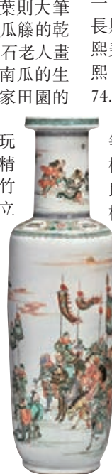
■ 康熙 五彩叩馬阻兵圖大棒槌尊