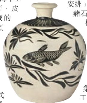
■ 北宋 金磁州窯白地黑花魚藻紋小口尊

南宋「哥窯葵口洗」，此件難得的哥窯葵口洗經過多年後重現東京中央拍賣場，實在令人興奮不已。此件哥窯洗呈矮角葵花型，造型古樸端莊，釉色厚潤如脂，周身紋片細密，深為紫褐色，淺為金黃色，紋片錯落不一，深淺交織，形成典雅優美的金絲鐵線。底部有六個支釘痕。使用支釘支燒形式在宋代「官窯」性質的窯口中相當普遍，傳世哥窯器中支釘也相當多，這也是將其定義為官窯系的重要依據。哥窯名列宋代五大名窯，在陶瓷史上有舉足輕重的地位。哥窯胎多為紫黑色、鐵黑色、也有黃褐色。釉為失透的乳濁釉，釉面泛一層蘇光，釉色以超米黃、灰青色多見，釉面大小紋片結合。