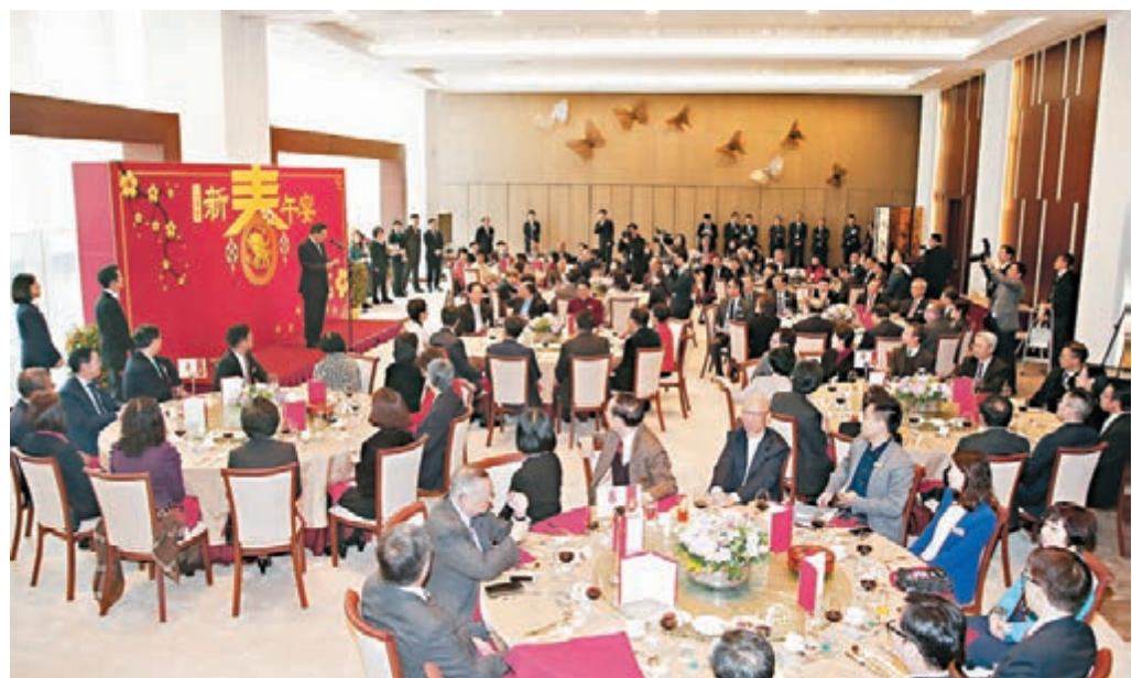
立法會主席梁君彥設新春午宴，場面熱鬧。