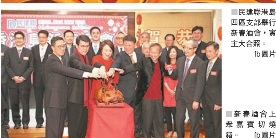
民建聯港島四區支部舉行新春酒會，賓主大合照。