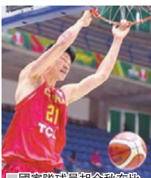
國家隊球員胡金秋在比賽中扣籃。