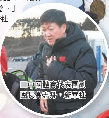
中國體育代表團副團長高志丹。新華社