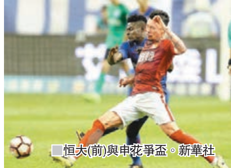
恒大(前)與申花爭盃。

另外，中超升班馬大連一方昨日表示，經與英超韋斯咸及球員本人協商一致，葡萄牙國腳西迪與大連一方完成簽約，正式加盟大連一方。