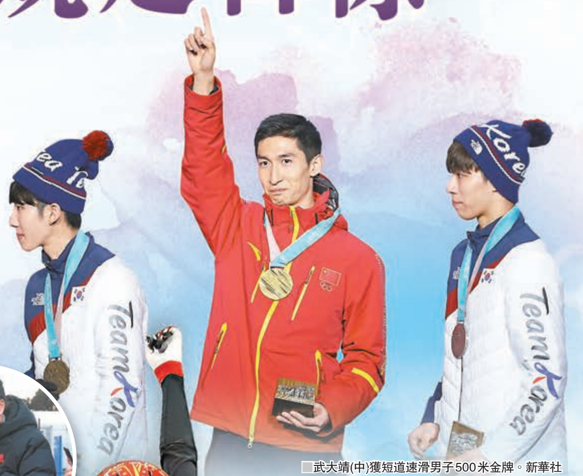
武大靖(中)獲短道速滑男子500米金牌。