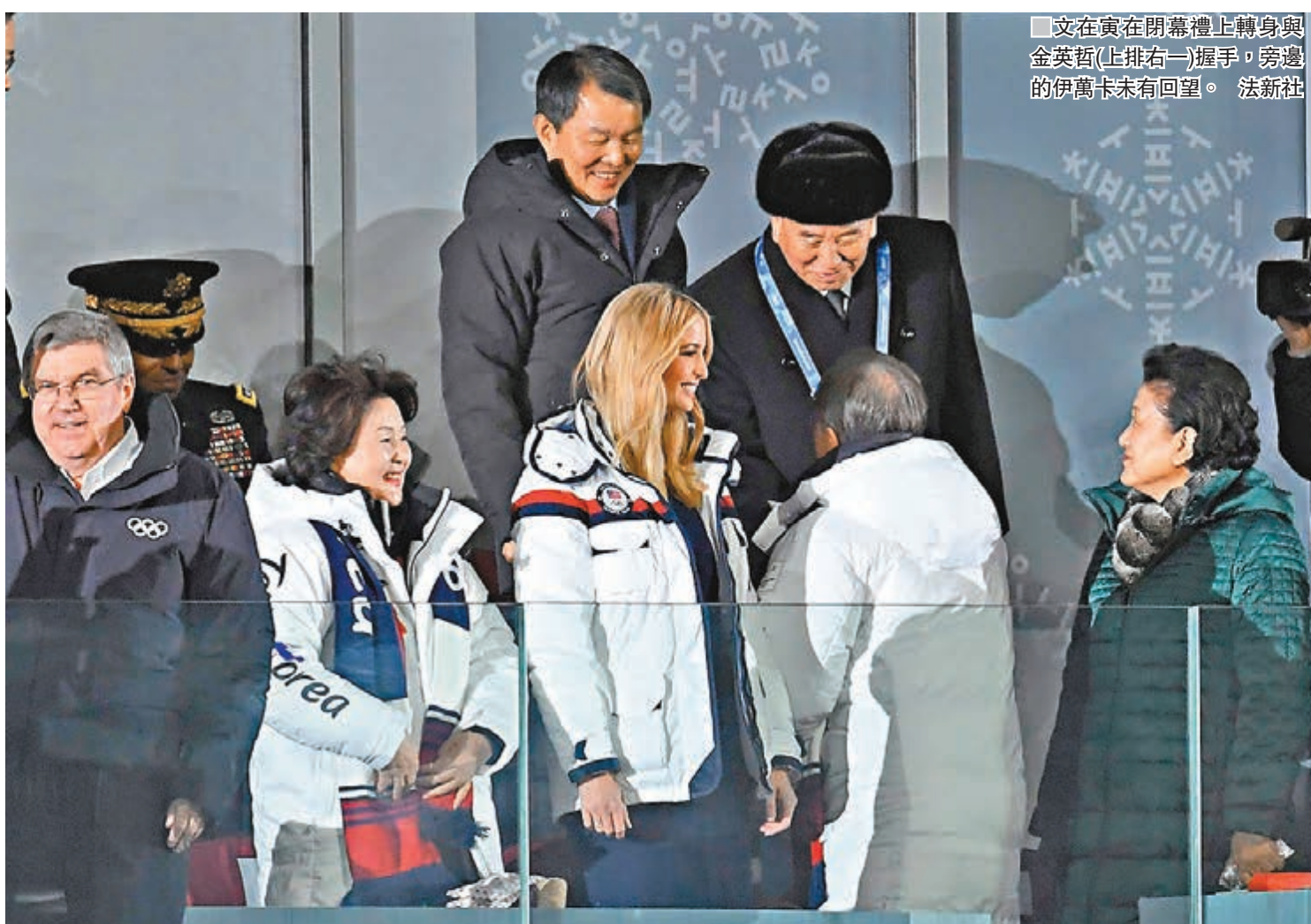
文在寅在閉幕禮上轉身與金英哲(上排右一)握手，旁邊的伊萬卡未有回望。