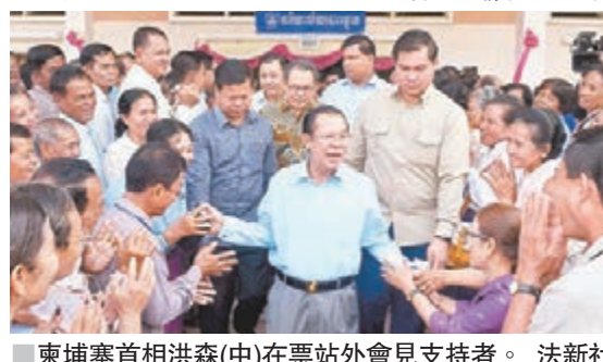
柬埔寨首相洪森(中)在票站外會見支持者。