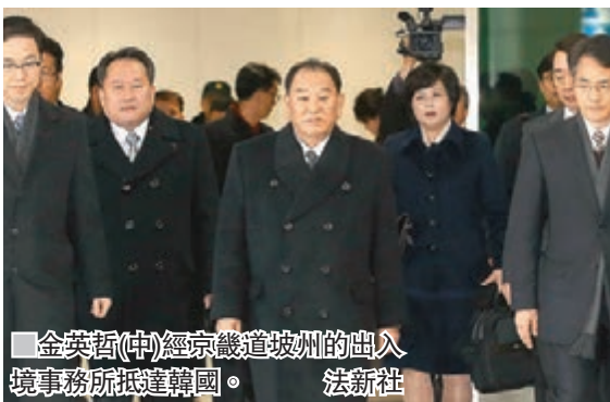
金英哲(中)經京畿道坡州的出入境事務所抵達韓國。