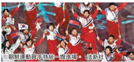
朝鮮運動員手持統一旗進場。