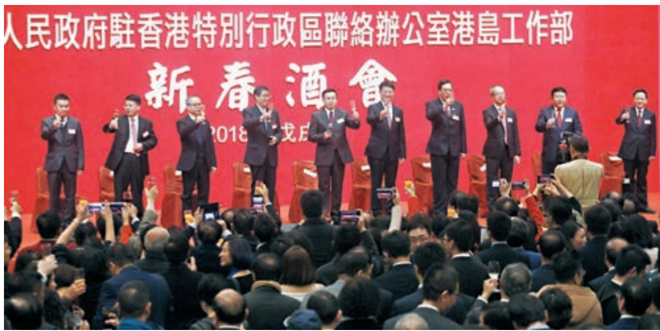
中聯辦港島工作部昨日在灣仔會展中心舉行2018年新春酒會。

香港文匯報訊(記者沈清麗)中聯辦港島工作部昨日在灣仔會展中心舉行2018年新春酒會，中聯辦副主任何靖，外交部駐港副特派員趙建凱，立法會主席梁君彥，民政事務局長劉江華出席主禮。中聯辦港島工作部部長吳仰偉致新春賀辭，強調新時代、新征程，惟有萬眾一心，奮鬥以成，才能開闢通往美好生活之路。