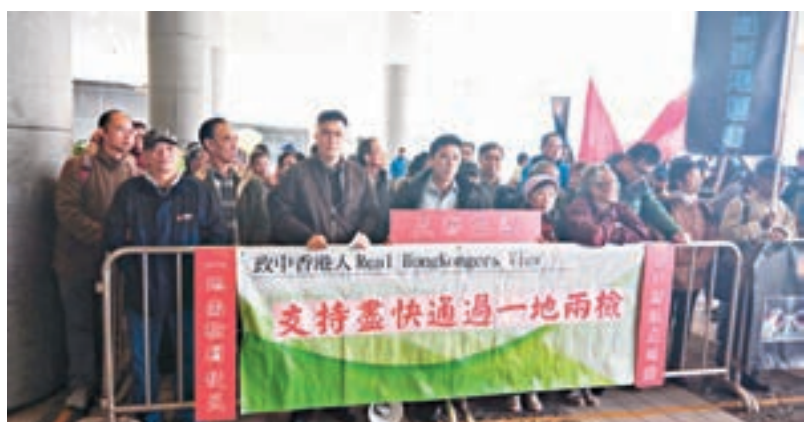
「政中香港人」促請立法會盡快完成本地立法。