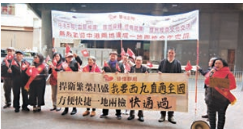
「珍惜群組」集會遊行支持「一地兩檢」。