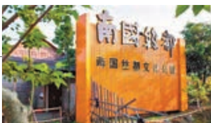
■ 佛山順德南國絲都文化公園。香港文匯報廣州傳真

為了讓市民更好地了解這段歷史，南國絲都絲綢博物館採取了與目前內地已有的少數絲綢展覽館不同的動靜結合方式，既提供文字、圖片資料介紹順德絲綢業的發展歷程和生產工藝，如