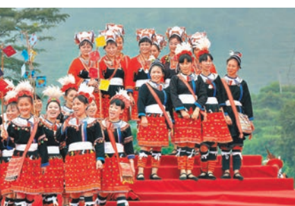
■ 到廣東清遠不僅可以欣賞精美的瑤族服飾，還可以欣賞熱情的瑤族歌舞。

在館內，遊客可以觀賞到五花八門的瑤族服飾，那細細密密的精細繡花、花樣繁多的銀飾，如果你是女孩子，「買買買」衝動實在難以抑制。從瑤族博物