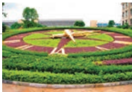
■ 珠海羅西尼鐘錶博物館是以鐘錶文化、時間歷史為脈的歐式風格建築。

香港文匯報廣州傳真 感受到鐘錶文化的發展歷程和源遠流長。參觀完博物館，遊客還可以近距離參觀生產流水線，滿足求知、求新、求異的心理。據介紹，將現代鐘錶生產過程及工藝流程對公眾開放展示，這在內地鐘錶業乃至精密製造行業領域尚屬首列。