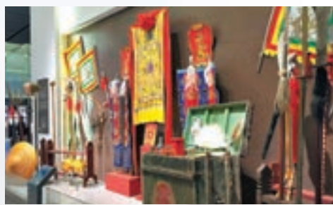
■ 著名的粵劇紅船。