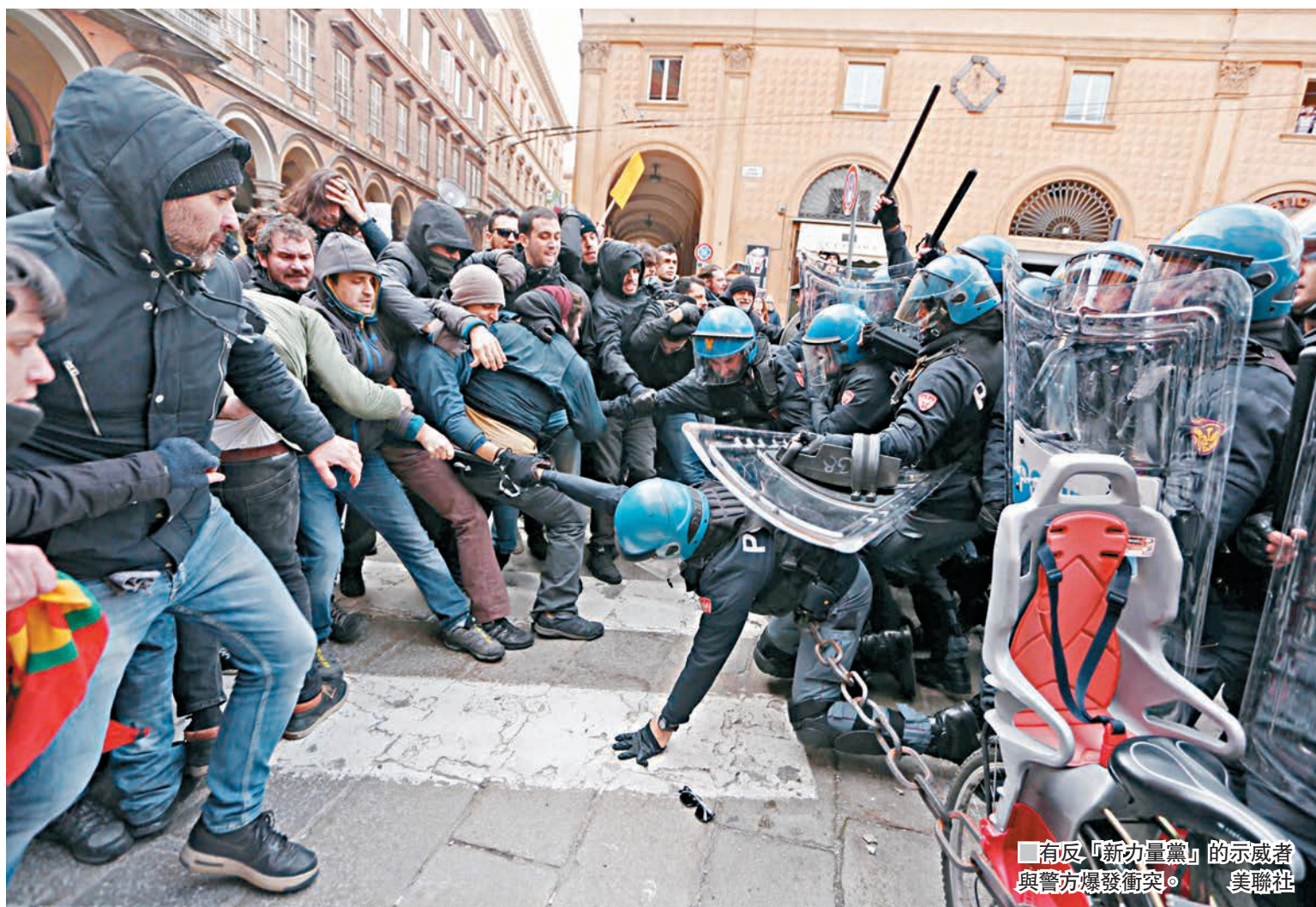
有反「新力量黨」的示威者與警方爆發衝突。