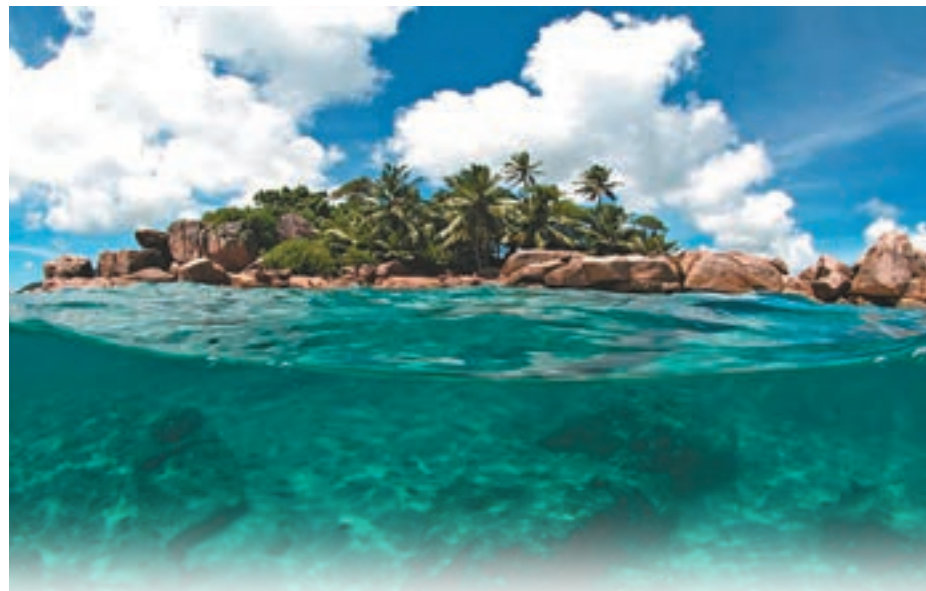
塞舌爾以沙灘水清沙幼聞名。網上圖片