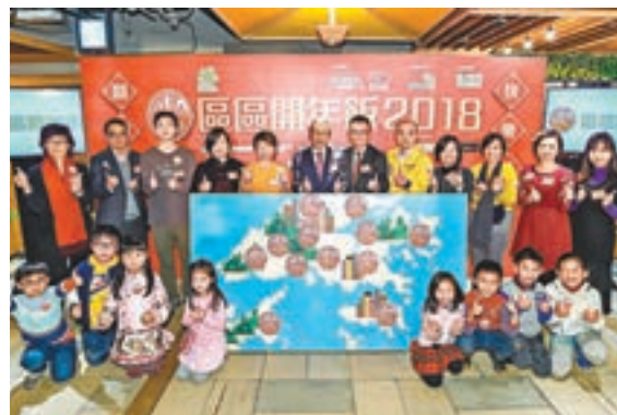
「區區開年飯」活動啟動禮,同場亦公佈「基層家庭度歲概況」先導研究調查報告。

康樂及文化事務署 Leisure and Cultural Services Department