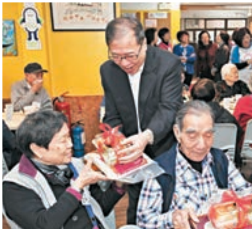
屈臣氏集團董事總經理黎啟明向長者送水果和白米。

香港文匯報訊(記者 文森)昨日是正月初七「人日」,約20名來自百佳的義工到深水埗惜食堂社區中心為一眾長者製作熱飯餐之際,「李嘉誠基金會」主席李嘉誠突然現身向長者及義工拜年,更與一眾老友記一同品嚐熱飯餐,為他們帶來驚喜。李嘉誠笑指自己快將成為真正的「九十後」,祝願大家身體健康,萬事順心如意。除了為每名長者送上水果及白米「手信」,他更當場以其基金會名義捐出1,000萬元予惜食堂,進行擴展社區服務等工作。