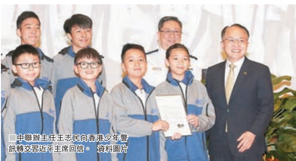
■ 中聯辦主任王志民向香港少年警訊轉交習總主席回信。

一是向習總書記高度重視「一國兩制」偉大事業、親力親為關心香港同胞的領袖風範看齊。習總書記高度重視「一國兩制」事業，將其作為中國特色社會主義的重要組成部分，並將堅持「一國兩制」和推進祖國統一確定為新時代治國理政的基本方略之一，彰顯了馬克思主義政治家的博大胸懷和領袖風範。特別是在春節前公務繁忙、日理萬機之際，連續3次對香港同胞親自表示關注關心並作出重要指示批示，既讓廣大香港市民感受到總書記的親切關懷，也讓中央駐港機構再次感受到極大鼓舞，深深感悟到「一國兩制」偉大事業作為「重大課題」在新時代黨和國家事