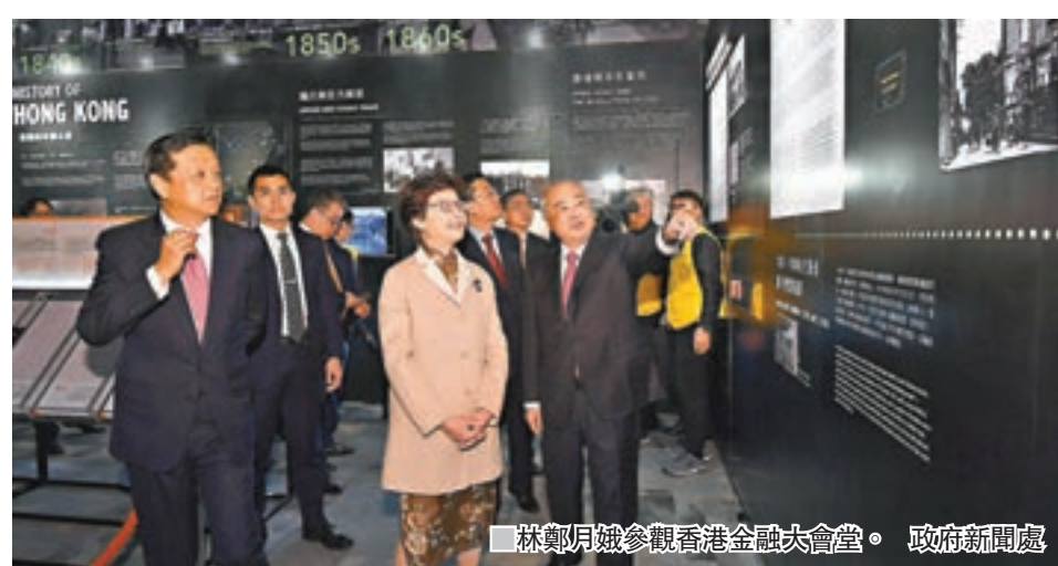
林鄭月娥參觀香港金融大會堂。

香港金融大會堂由去年10月尾開始重新裝修，足足用了約4個月時間大變身。據資料顯示，大會堂佔地超過30,000方呎，過往的交易座位改建建成多個多功場地，可