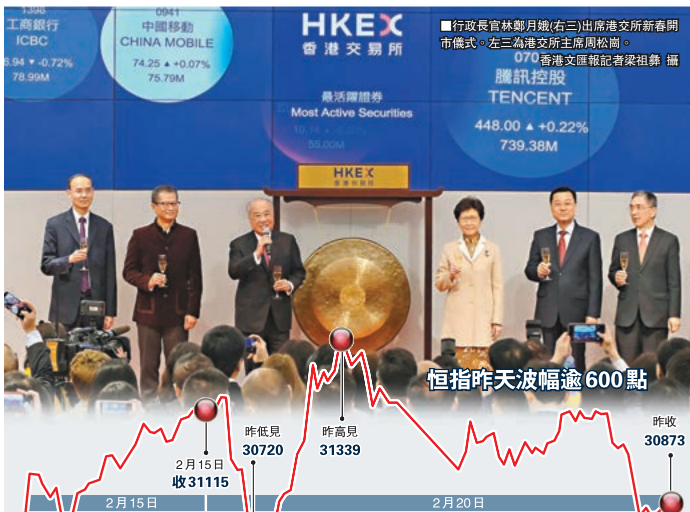
恒指昨天波幅逾600點