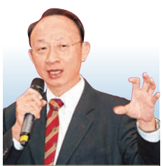
黎偉成 資深財經評論員