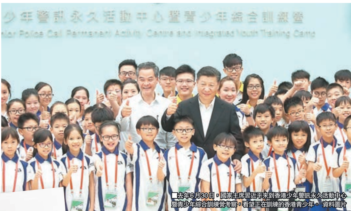
去年6月30日，國家主席習近平來到香港少年警訊永久活動中心暨青少年綜合訓練營考察，看望正在訓練的香港青少年。

香港文匯報訊（記者 朱明文）國家主席習近平在2月14日春節來臨之際，給香港少年警訊成員回信，感謝他們寄送親手製作的新春賀卡，並強調祖國和香港未來寄託在年輕一代身上，希望他們多學歷史、多了解國情，以實際行動服務香港、報效國家。香港中聯辦主任王志民在15日、農曆年三十當日，邀請26名少年警訊成員到中聯辦大樓，向他們轉交了習主席的回信，希望各少訊成員不負習主席期望，把愛家和愛國統一起來，把個人夢、家庭夢融入國家夢、民族夢之中，努力學習，早日成才，而中聯辦也會和香港青年同心同行，一起走向美好未來。