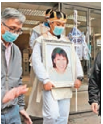
死者周女齊出殯。