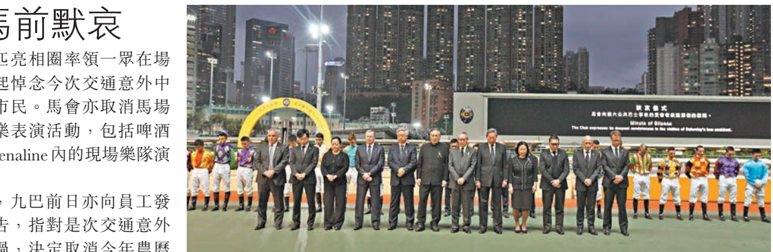
跑馬地夜馬，賽前馬會董事和入場馬迷為大車禍死者默哀。

香港文匯報訊(記者 聶曉輝)馬會昨晚於跑馬地馬場舉行8場賽事。鑑於大埔日前發生一宗奪去19條人命的車禍，加上肇事巴士當日是在沙田賽馬園和adrenaline內的現場樂隊演奏。 另外，九巴前日亦向員工發內部通告，指對是次交通意外深表難過，決定取消今年農曆新年的所有團拜活動，希望各同事理解及支持。