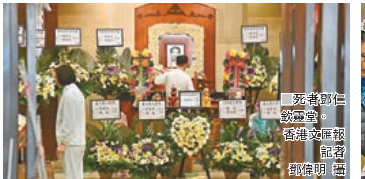
死者鄧仁欽靈堂。