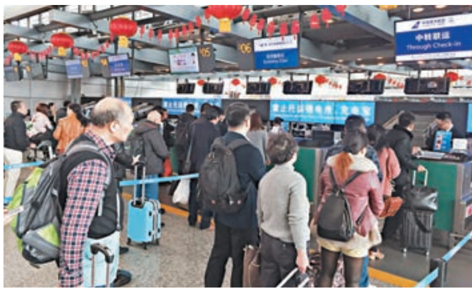
■白雲機場迎來旅客出行高峰,給安保工作帶來了巨大挑戰。

在智能安保系統下,每發現一個問題貨件,指令會立即上報,迅速倒查,並即時完成處置程序。春運截至日前,已經有2宗問題貨物被及時發現,消除了航班安全隱患。