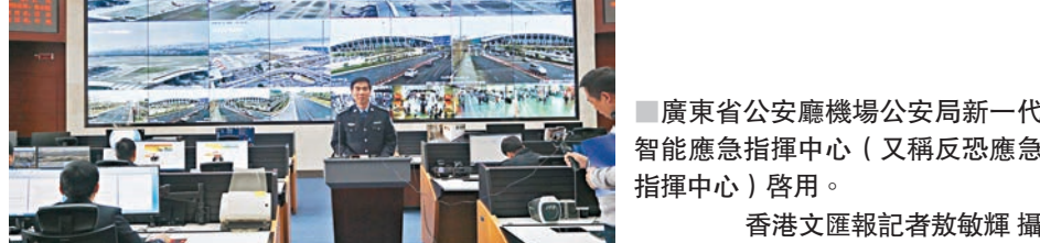
■廣東省公安廳機場公安局新一代智能應急指揮中心(又稱反恐應急指揮中心)啟用。