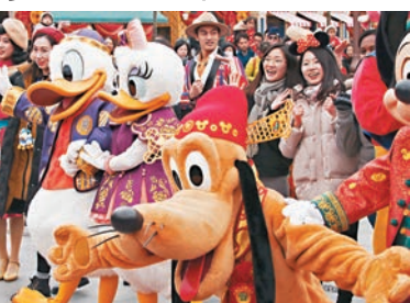
■假期優惠與春節的雙作用下,滬迪園迎來大客流。圖為上月底在滬迪園啟動的迎接中國農曆狗年春節系列活動。 資料圖片

香港文匯報訊(記者 倪夢環 上海報道)在假期票價優惠以及春節雙重推動下,滬迪園再迎來客流高峰。據了解,本月12日至14日滬迪園門票均已售罄,昨日園內熱門項目排隊時間更超過3小時。根據其官方APP顯示,昨日園內熱門項目自開園起10分鐘後便排長隊,飛越地平線項目等候時間甚至一度超過3小時,包括雷鳴山漂流、創極速光輪、7個小矮人礦車在內的項目,都受到了追捧,排隊時間幾乎都保持在一小時以上。據悉,今年滬迪園將開放新園區,同時亦會呈現新的中文版音樂劇《美女與野獸》等。