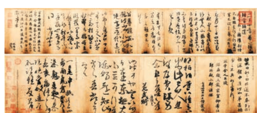
■唐摹王羲之一門書翰(又稱萬歲通天帖)全卷。 網上圖片