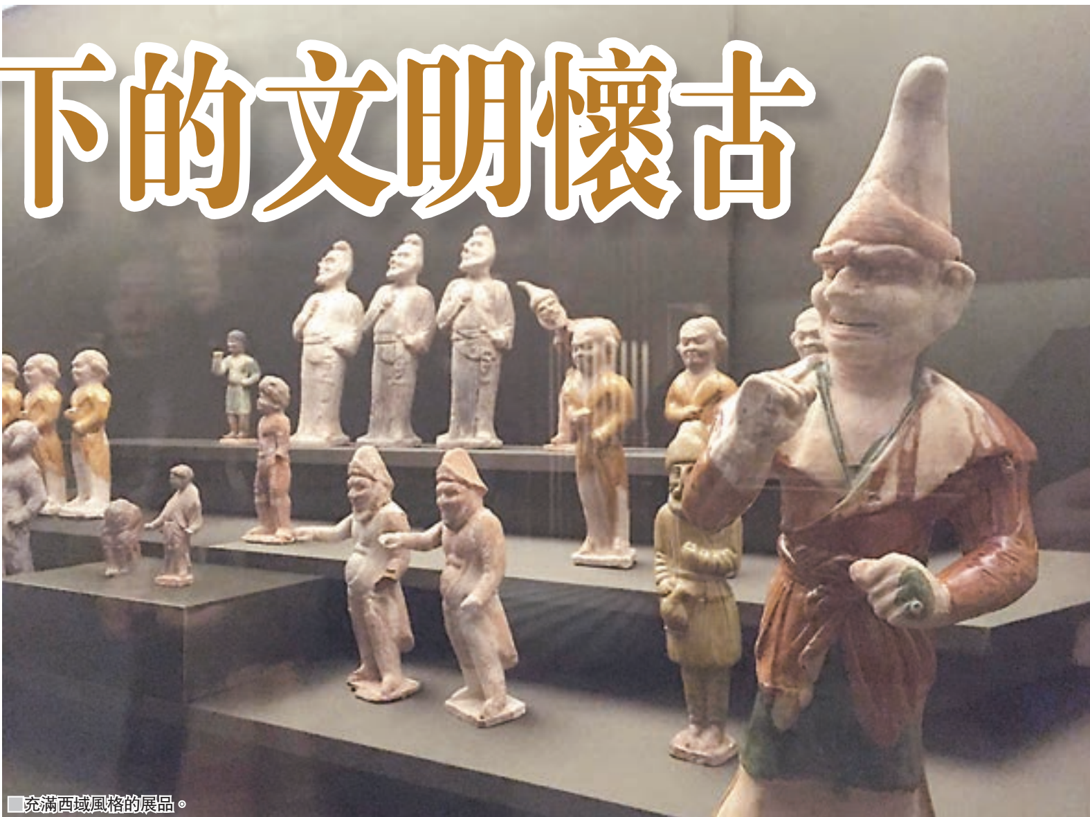
充滿西域風格的展品。