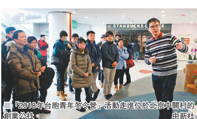
「2018年台胞青年冬令營」活動走進位於北京中關村的創業公社。

溝通平台，讓台灣青年親身感受到內地的變化與發展，加強友誼與聯繫，繼續傳承中華民族優秀的歷史、文化。