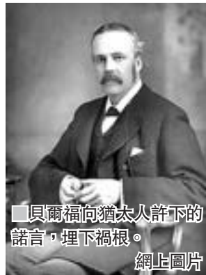
貝爾福向猶太人許下的諾言，埋下禍根。

政府借出400萬鎊購買蘇彝士運河的股票，讓英國控制了該運河，從經濟、政治和軍事上帶來巨大收益。