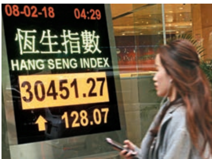
港股昨一度彈升416點,收市升幅收窄,成交大縮至1,496億元。

石油股拖低大市,中石化(0386)及中海油(0883)是跌幅頭兩大藍籌,令國指受累再跌52.9點,收報12,380點,連跌第4日。