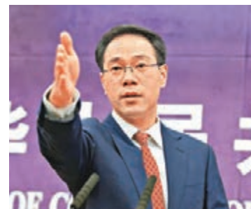
商務部新聞發言人高峰。

「我們希望把冬奧會期間的對話延續到日常不間斷的對話，把朝韓之間的互動擴大到各方尤其是朝美之間的互動，把南北改善關係的努力拓展到維護半島和平穩定、實現半島無核化的共同努力。我相信，事在人為，只要大家齊心協力，相向而行，半島對話談判之門肯定會有被重新開啟的那一天。」王毅說。