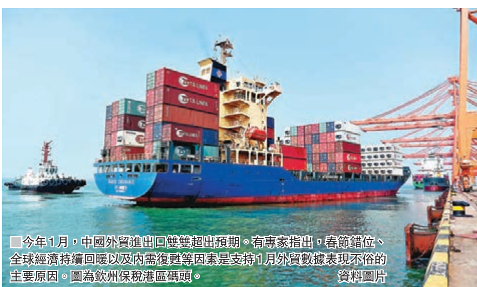
今年1月，中國外貿進出口雙雙超預期。有專家指出，春節錯位、全球經濟持續回暖以及內需復甦等因素是支撐1月外貿數據表現不俗的主要原因。圖為欽州保稅港區碼頭。

香港文匯報訊（記者 馬琳 北京報道）外貿進出口雙雙超預期，迎來開門紅。海關總署昨日公佈數據顯示，今年1月份，按人民幣計價，中國貨物貿易進出口比去年同期（下同）增長16.2%。其中，出口增長6%，預期為2.6%；進口增長30.2%，預期為5.3%；貿易順差收窄近六成。對此，外貿專家指出，春節錯位、全球經濟持續回暖以及內需復甦等因素是支撐1月外貿數據表現不俗的重要原因。