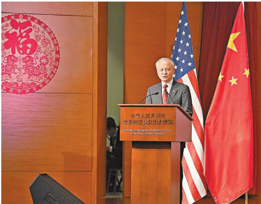
■中國駐美大使崔天凱表示，中美關係在過去一年總體上實現平穩過渡、穩中有進。而對於去年底有西方傳媒用「銳實力」來形容中國，崔天凱說，中國貢獻的不是什麼「銳實力」，而是「新選擇、智實力和正能量」。

香港文匯報訊 據中新社報道，中國駐美大使崔天凱日前在使館內出席春節聯歡活動時就近期美方有關中美關係的多個誤判作出回應。崔天凱表示，中美關係在過去一年總體上實現平穩過渡、穩中有進。而對於去年底有西方傳媒用「銳實力」（指某些國家政權操控國外輿論的能力，編者注）來形容中國，反映出他們對中國認知的缺失和對中國戰略上的誤判，中國貢獻的不是什麼「銳實力」，而是「新選擇、智實力和正能量」。崔天凱說。