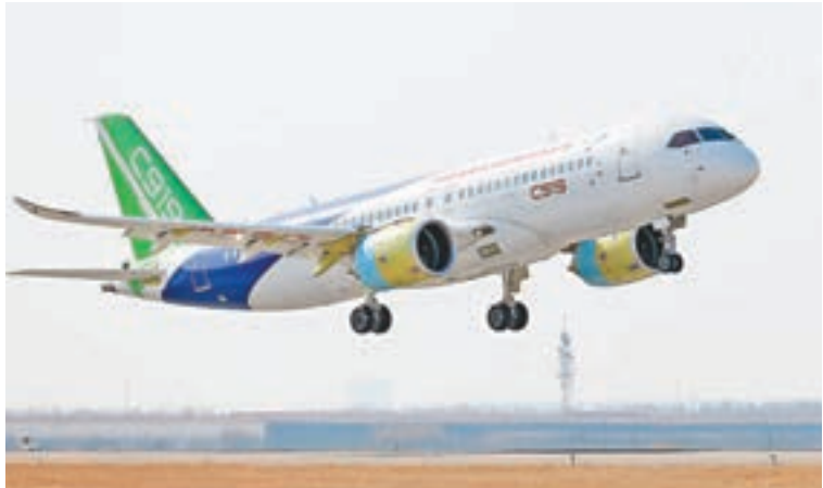
■中國商用飛機有限責任公司6日稱，將於2021年交付首架國產大型客機C919單通道客機。圖為去年12月17日，第二架國產大型客機C919在上海浦東國際機場起飛。