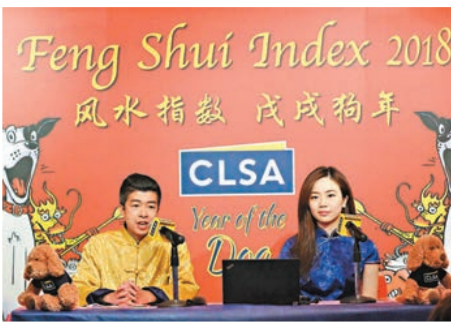
里昂風水指數預測狗年恒指全年走勢呈「高、低、高」。

中信里昂風水指數誕生於1992年,最初只是在新春佳節來臨時寄給客戶的賀卡,當中簡要歸納了多位風水大師的神機妙算輔以該行觀點,結果準確地預測了恒指當年全部七個主要轉折點,因而聲名大噪。