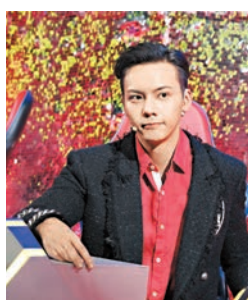
陳偉霆近來在內地相當受歡迎。

年他做了很多作品,有演唱會、電視劇、電影,也上過春晚舞臺,是「沒有遺憾的一年」。對於2018年,他希望讓大大家多多認識他跳舞的一面:「因我覺得2018年將會有很多人關注跳舞這件事,我想讓大家看到原來我們有很多年輕人跳舞是很棒的。」