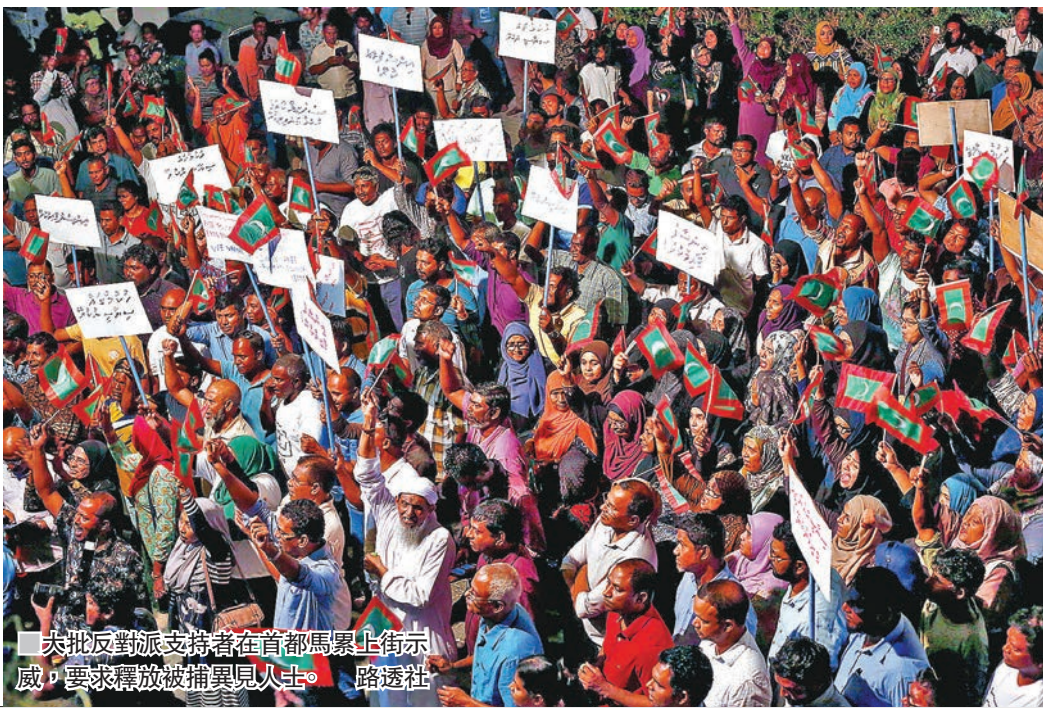
大批反對派支持者在首都馬累上街示威，要求釋放被捕異見人士。