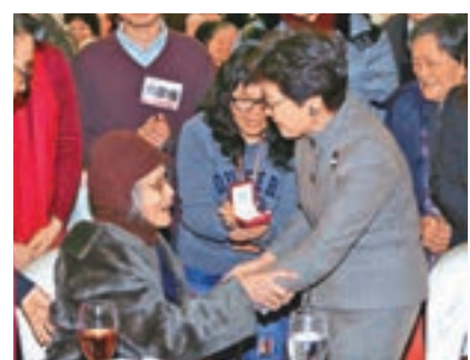
長者對林鄭到來表示非常雀躍(上圖及下圖)。