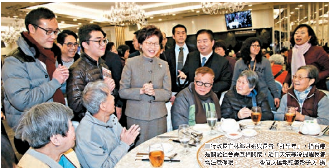
行政長官林鄭月娥與長者「拜早年」,指香港是關愛社會需互相關懷,近日天氣寒冷提醒長者需注意保暖。