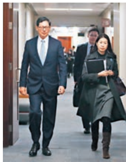
陳德霖（左）出席財經事務委員會會議。

環球股市去年大收旺場，外匯基金超過一半投資收益均來自股市。對於股市近日出現調整會否影響外匯基金投資收益，陳