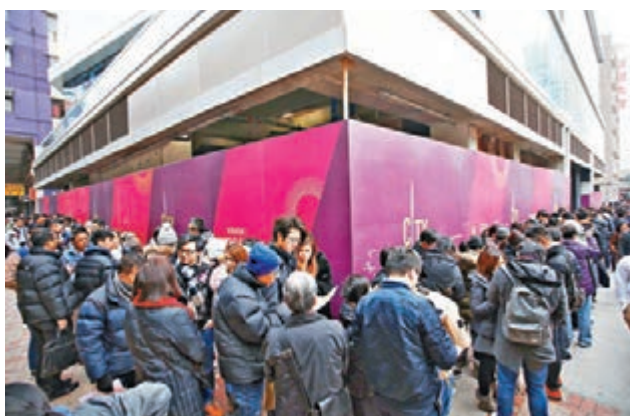
津匯昨開售84伙,售樓處現排隊人龍。

香港文匯報訊(記者 張美婷)雖然天氣寒冷及農曆新年臨近,但新盤銷情仍然不俗。過去周六日一手市場共售出約185伙,較之前一周約200伙略減7.5%。由寶聲集團、其士國際及市建局合作的土瓜灣津匯昨首輪開售84伙,其銷售成績理想,據市場消息透露,截至昨日下午3時半已售出65伙,佔開售單位逾7成半。其士國際副董事總經理譚國榮昨日表示,項目加推步伐將視乎銷情,料最快於本周加推,並於本周六進行次輪銷售。 津匯昨日早上9時讓指定組別報到,直至約10時開始揀樓。據記者現場觀察,售樓處排隊人流眾多,而秩序亦尚算良好。據市場消息透露,昨日分A至E組別, A組的到場客人已達88位。譚國榮表示,項目截至正午暫售逾50伙,而就現場所見,買家以區內客佔多,當中約半數為年約30歲的年輕人。寶聲集團房地產部總經理何錫添表示,項目大部分買家購1伙。 美聯物業住宅部行政總裁布少明表示,該行A及B組的出席率約80%。當中不少為年輕人,80至90後的買家有70%,投資者亦有不少。他認為項目日後實用呎租可達60元,賬面租金回報4厘。另他表示,受農曆新年影響,相信2月一手及二手