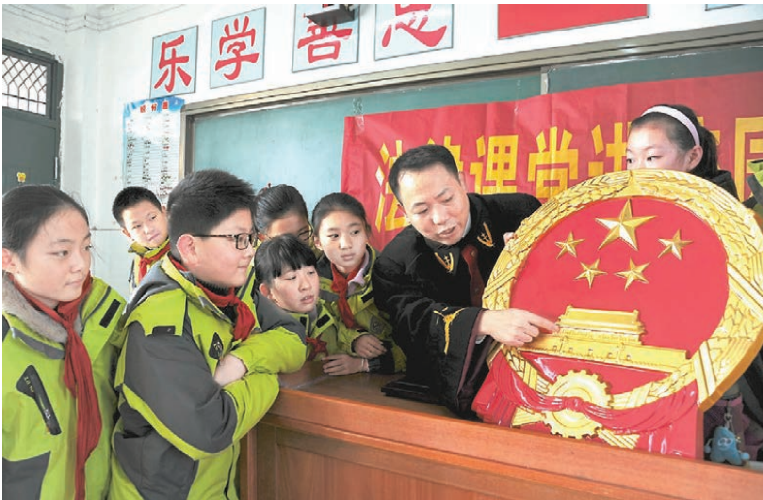
■下月召開的十三屆全國人大一次會議將審議憲法修正案草案，使憲法再次成為焦點。圖為2016年12月2日，法官指導同學們學習法律知識。

最後，憲法的修改程序肯定比制定、修改一般法律更為嚴格。在慣例上，為保證憲法修改的慎重性和嚴肅性，憲法修正案由中共中央成立修憲領導小組先行在廣泛徵求各方面意見的基礎上擬定，由中共中央向全國人大常委會提出憲法修正案草案。同時，在全國人大常委會通過憲法修正案草案以後，通常還需要一段時間，在全國範圍內進行全民討論，以徵求全民的意見。對於法律的修改，上述兩個程序並不是必經程序。