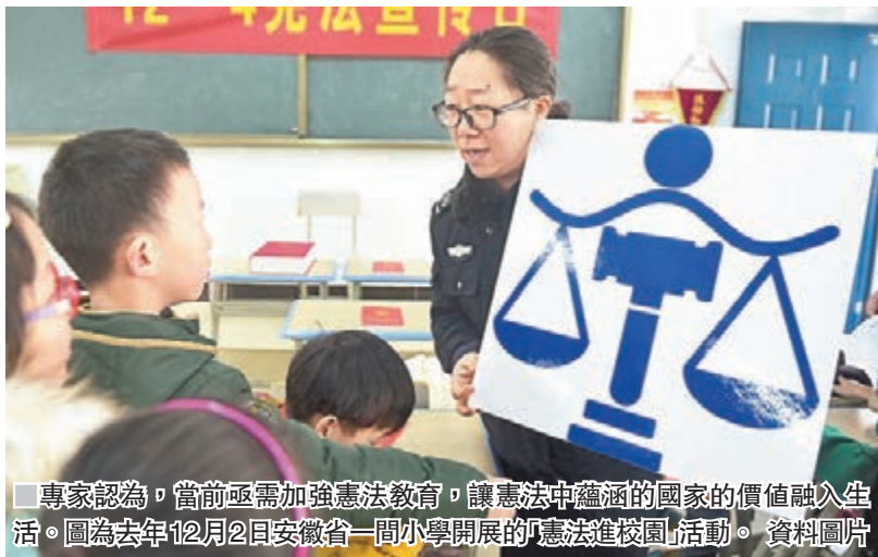
■專家認為，當前亟需加強憲法教育，讓憲法中蘊涵的國家的價值融入生活。圖為去年12月2日安徽省一間小學開展的「憲法進校園」活動。