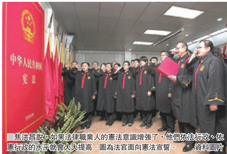
■焦洪昌說，如果法律職業人的憲法意識增強了，他們依法行政、依憲行政的水平就會大大提高。圖為法官面向憲法宣誓。