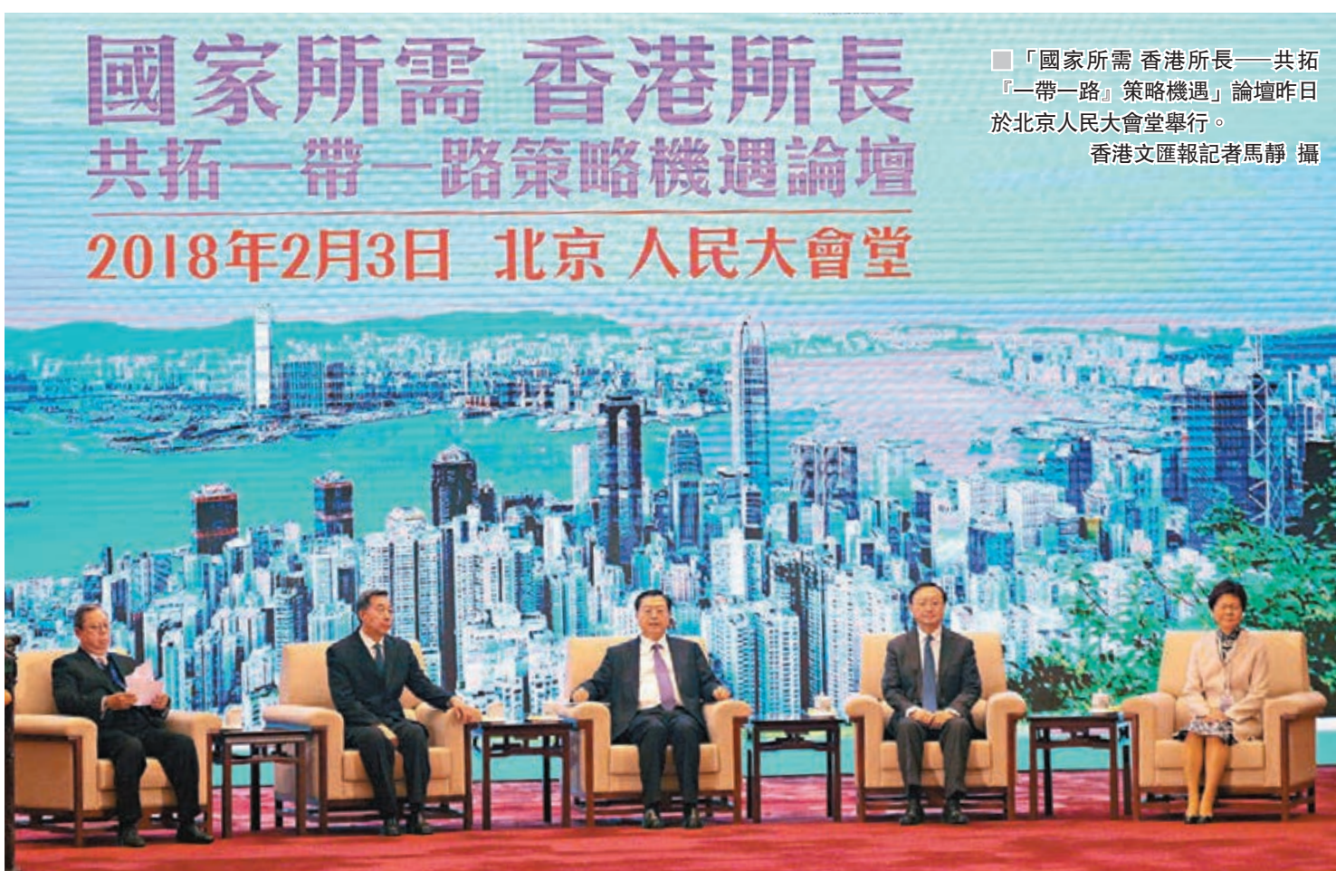
「國家所需 香港所長——共拓『一帶一路』策略機遇」論壇昨日於北京人民大會堂舉行。

他希望特區政府做好推廣和促進工作，各行業做好參與者和建設者，社會各界做好支持者和宣傳者，共同把握「一帶一路」帶來的歷史性機遇，繼續提升香港金融和其他專業服務業競爭力，對香港經濟發展社會民生改善持續供應力。