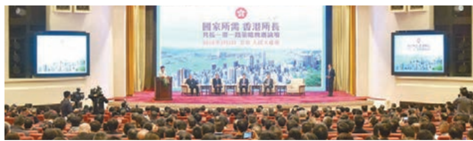
香港特區政府和「一帶一路」總商會舉辦的「國家所需 香港所長——共拓『一帶一路』策略機遇」論壇昨日在北京人民大會堂舉行。

香港文匯報訊（記者 馬靜、馬琳 北京報導）國家主席習近平提出「一帶一路」倡議5年來，獲多個國家和地區積極響應。全國人大常委會委員長張德江在論壇上細數「一帶一路」的「五通」——政策溝通、設施聯通、貿易暢通、資金融通及民心相通取得的成果，強調「一帶一路」成就有目共睹，前景鼓舞人心。