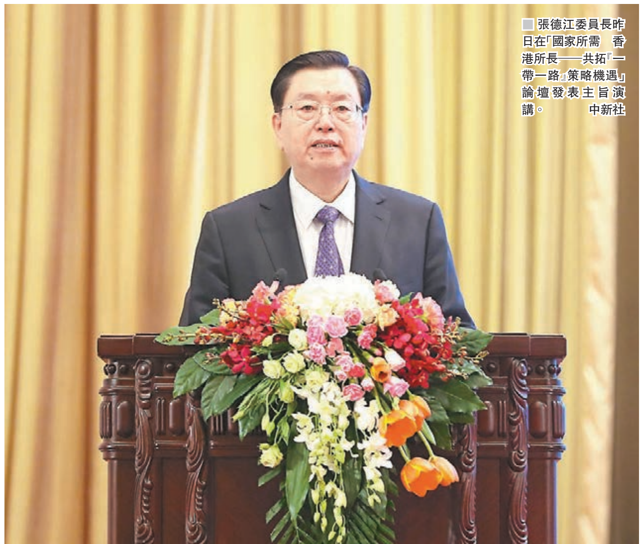
張德江委員長昨日在「國家所需 香港所長——共拓『一帶一路』策略機遇」論壇發表主旨演講。

張德江最後說，十九大揭開了中國特色社會主義新時代的序幕，開啟了全面建設社會主義現代化強國新征程。在以習近平同志為核心的中共中央堅強領導下，全國各族人民正為實現十九大所描繪的宏偉藍圖而團結奮鬥，「我們堅信，素有愛國傳統的香港同胞，一定能與祖國人民心連心、肩並肩，共擔民族復興的歷史責任，共享祖國繁榮富強的偉大榮光，共築中華民族偉大復興的中國夢！」