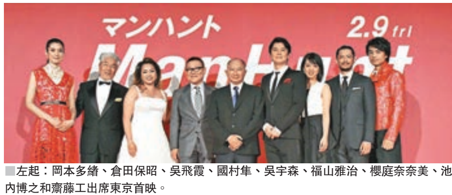
左起：岡本多緒、倉田保昭、吳飛霞、國村隼、吳宇森、福山雅治、櫻庭奈奈美、池內博之及齋藤工出席東京首映。