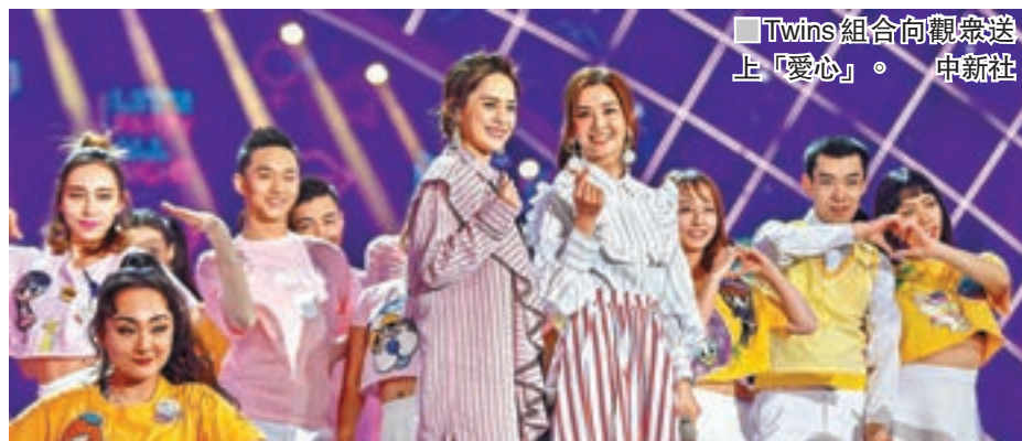
Twins組合向觀眾送上「愛心」。