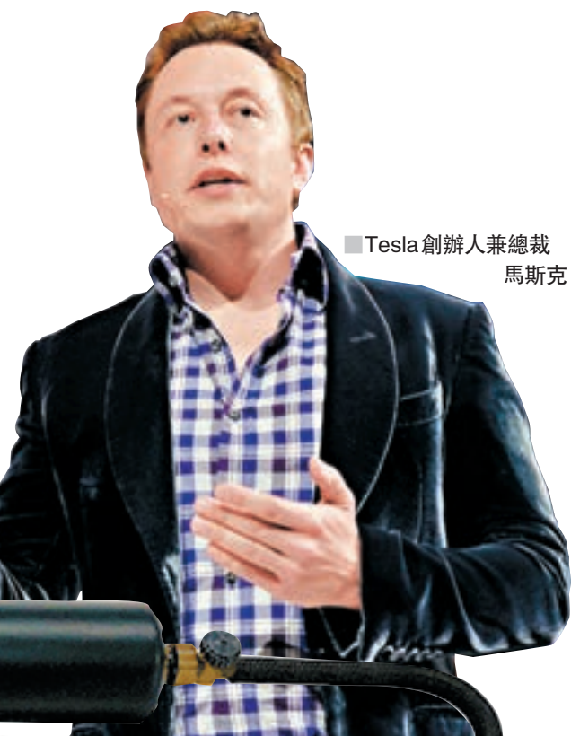
■ Tesla 創辦人兼總裁 馬斯克