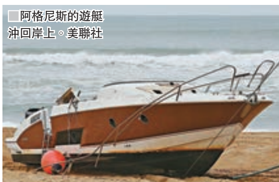
■阿格尼斯的遊艇沖回岸上。